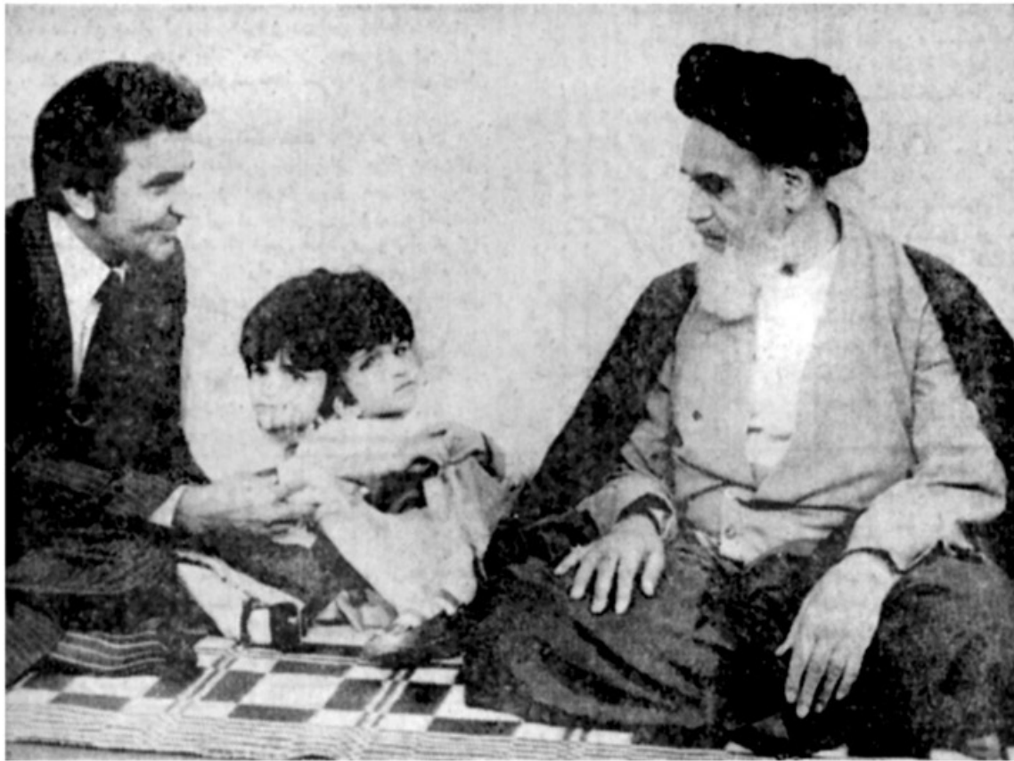
دوقلوهای بهم چسبیده به حضور امام رسیدند

لاله ولادن، دوقلوهای بهم چسبیده بانگ پزشک معالج خود و همراهمخبرنگار مجله اطلاعات جوانان به حضور امام خمینی رهبر انقلاب ایران رسیدند.