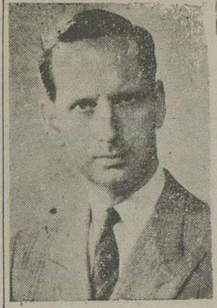
رئیس سازمان جوانان سلیب احمرها