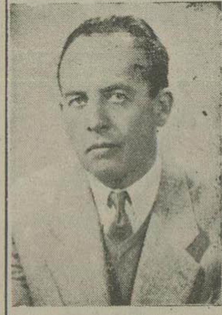
آقای دکتر هانچف معاون اداره بهداشت اتحادیه سلیب احمرها نیز بلغارستان بوده و دارای درجه دکترای طب و دیپلم در امور بهداشتی میباشد.