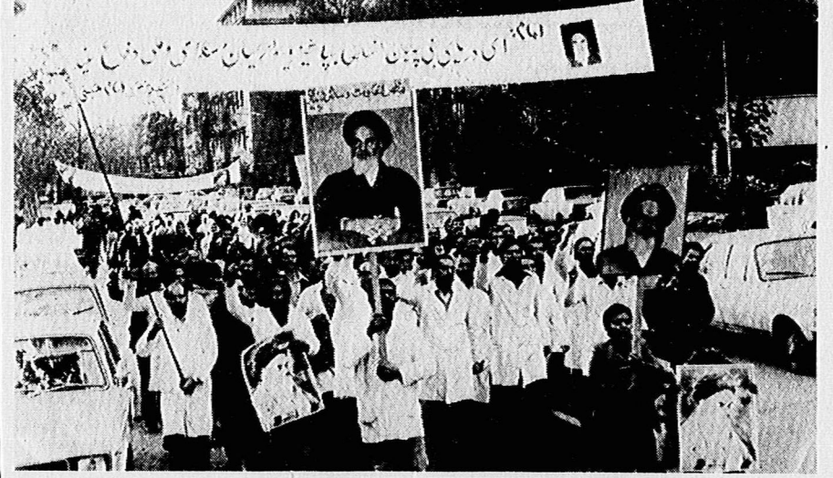
دانشجویان دانشکده امام خمینی در راهپیمایی بسوی لاه جاسوسی امریکا (دیروز بعد از ظهر)