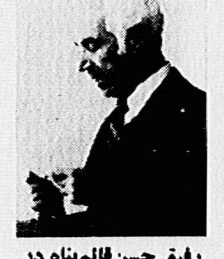
رئیس حسن قائم‌بناه در حال سخنرانی

باین کمتر زعمل کنونی انبارهای عمومی کلاً به‌زیان مصرف کننده است. مهندسان هیچ اقدام قاطعی برای رسیدگی به وضع انبارهای عمومی انجام نشده است. اینبارها را انبارها از به‌وقت گزارش به‌تجاه اجاره می‌دهند و علاوه بر اجاره، حق انبار نیز دریافت می‌کنند. البته این مسئله ضرری متوجه تجار نمی‌کند، زیرا آنها هر چه می‌کشند روی قیمت کالا می‌کنند. در نتیجه با ضرر نه‌الی متوجه مصرف کنندگان می‌شود. این انبارها اغلب بین ۱۵ تا ۱۸ درصد سود کسب می‌کنند. اینها بسیار کم است. این کارگران اینهمه سود داشت بر خود ابراز حسرت و در مقابل خطرات ناشی از آن که هیچ‌وجه تا این حد ندارد. این انباران حتی از دانه‌های کتان و دوسکتین به آنها خسوداری می‌کنند.