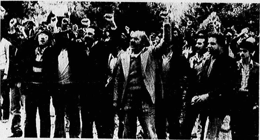
گوشه‌ای از مراسم یاد بود شهدای ۱۶ آذر در شیراز

پریروز طی تظاهراتی در شهرهای خوی و بناب آذربایجان، مردم با صدور قطعنامه‌ای خواستار انحلال حزب جمهوری خلق مسلمان شدند. در این قطعنامه اعلام شده است که حزب جمهوری خلق مسلمان به‌بهرترین پناهگاه برای عناصر فاسد و ضد انقلاب تبدیل شده است و تقاضا شده است که هر چه سریعتر منحل گردد. مردم خوی و بناب سپس دو حمله هم‌ساعت دولتی و رادیو تلویزیون تبریز را پشت محکوم کرده و خواستار تصفیه ادارات دولتی از وجود عناصر ناپاک و ضد انقلاب، شدند.