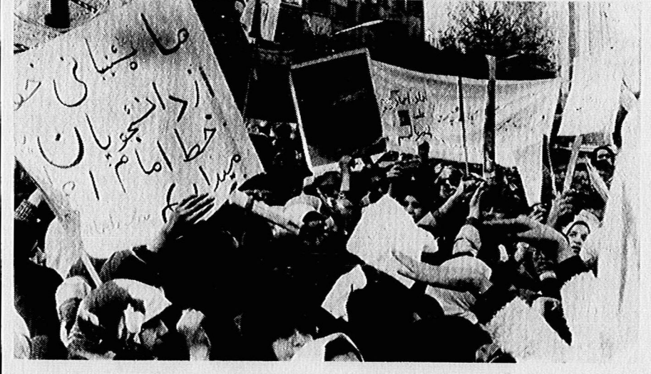
دانش آموزان مدرسه راهنمایی ساراب در برابر لاه جاسوسی امریکا (دیروز بعد از ظهر)