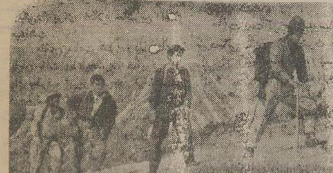
چهار نفر کوهنوردن گروه سیار پیش از هفتی در راه قله خرسنگ

شنبه ۲ مرداد ۱۳۳۳ ۲۳ ذیحجه ۱۳۷۳ ۲۴ ذویه ۱۹۵۴ طلوع آفتاب: ساعت پنج و ۷ دقیقه غروب آفتاب: ساعت ۳ و ۱۹ دقیقه شماره جدید تلفنهای آتش نشانی ۴۴۴۴۴ و ۴۴۴۴۴ برنامه سینماها ایران - باغ بهنایی باشترک؛ مارگارت اوربرین - دین استوکولم ری - جانباز (رنگی) باشترک؛ آنتونی داکتر - جودی لاورنس تهران - فرشته صحرا (فیلم عربی) رکس و همها - آخرین مقاومت باشترک اول فلین - پاتریک و بیور مشرق پل - انتقام جوان امریکائی باشترک جون بول - ادل مارو پارک - عروسی شب عربی (عربی) باشترک؛ اسماعیل یاسین مایاک - (زستانی) و دیانا (تابستانی) عروس دریا (فیلم عربی) دیانا - (زستانی) بسوی غرب (رنگی) باشترک؛ ایوبن دوکارلو - جان روسل البرز - سامونو دلیل (رنگی) باشترک هدی لامار - ویکتور میجر سنت دیگر حیاط محمد ناصر ایستاده و چاقوی خون آلودی هم در دست اوست و رنگ و روی خود را باخته و مرتباً نفس میدهد و وظیف بیکتا همه در کنارش ایستاده اند. همسایگان فردا کلاتری محل را مطلع نمودند و مامورین بلافاصله محمد ناصر را بازداشت کردند و چنانچه به بیمارستان سینوا از آنجا پزشک قانونی عمل کردند و جواز دفن بنام متوفی صادر نمودند محمد ناصر بلا فاصله بداد ای نظامی منتقل شد و از وی باز پرسى بعمل آمد. در موقع باز پرسى محمد ناصر بعد از خود اعتراف کرد و علت آنرا عملیات مخالف با عفت ذکر کرد. سرگرد بهزادی باز پرسى در اسرای نظامی قلرا قتل عمد تشخیص داد و برای ادامه باز پرسى رز نه را تکید کرد و بنوعی زن وارد آورد و زن بیچاره در حالیکه فریاد میزد بدام بر سر میزد مردم بزین افتاد. در این وقت همسایگان وارد منزل شدند و زن را دیدند که در یک سمت حیاط افتاده و خون از وی جاریست و در