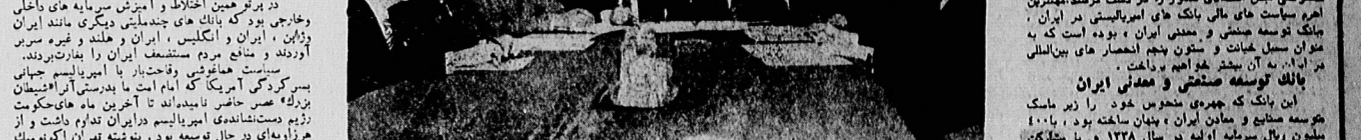
بانک ملی و بانک توسعه صنعتی و معدنی ایران... در مراسم افتتاحیه بانک توسعه صنعتی و معدنی ایران

مستمرن لاهم سیاست‌های ملی‌بانک‌های امپریالیستی... در دوران «بانک توسعه صنعتی و معدنی ایران» بوده است