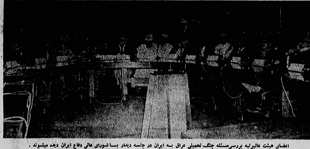
اعضای هیئت عالیترتبه بررسی مسئله جنک تعمیلی عراق به ایران در جلسه دیدار با شورا عالی دفاع ایران دیده میشوند.

داستان بلو کشیدن ثروت های ایران در صفحات ۷ و ۸ از سوی مقامات انگلستان ۹۰۰ هزار لیره ثروت شاه معدوم به خانواده اش واگذار شد