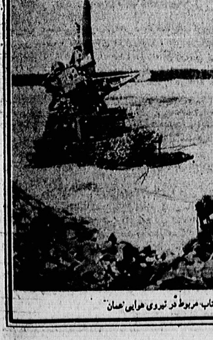
مرنگ شدن نفت های عراقی میم با رادار و دستگاه برتاب مربوطه نیروی هوایی عمان

معرفی ادنیهای جهان «عمان» (۲) نیروی هوایی نفرات: ۱۸۰۰ نفر هواپیمای: ۳۸ فروند چنگنه ۱ اسکادران چنگنه و رهگیری، شناسایی مرکب از ۱۲ فروند هانتز - ۴ و FGA-۵ ۲ اسکادران هواپیمای چنگنه مرکب از ۸ فروند «مگما» - ۱ (MK-1) و ۲ فروند T-2 ۳ اسکادران هواپیمای ضد شورش - تعلیماتی مرکب از ۱۷ فروند BAC-167 هواپیمای BAC-111 و ۱ اسکادران از ۳ «دفینر» و ۱۲ «اسکی ونه» سربیس هوایی سلطنتی مرکب از: ۱ اسکادران از ۷ «اسکی ونه» ۱ اسکادران حمل و نقل VC-10 ۲ فروند تعلیماتی