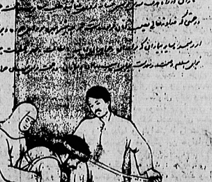
لوحه مرحمتی امام خمینی به جامعه پزشکان و پرستاران و محرومان جنگی

وزیر بهداری در بیان تصمیمات وزارت بهداری، گفت: «ما در این سفر به کشورهای متعددی سفر کردیم و دیدارهای مفیدی با مقامات این کشورها داشتیم. ما در کوبه و نیکار آگوئه دیدارهای مفیدی با مقامات این کشورها داشتیم و در مورد راههای همکاری با آنها بحث کردیم.»