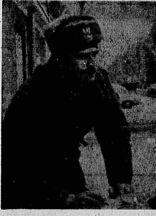
نشانه های بحران در آژوآنتین بروز کرده است بگزارش آژوآنتین، نشانه های بحران در آژوآنتین بروز کرده است

مراسم سالگرد پیروزی انقلاب اسلامی در لیورپول بگزارش خبرگزاری جمهوری اسلامی از لیورپول، سیمین سالگرد پیروزی انقلاب اسلامی در لیورپول، مراسمی با حضور مقامات محلی و ایرانی برگزار شد مقامات محلی لیورپول در مراسم سالگرد پیروزی انقلاب اسلامی در این شهر، سخنرانی کردند و بر اهمیت صلح و همکاری بین المللی تأکید کردند