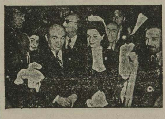
والاحضرت اشرف پهلوی در هنرستان دختران

دیروز مراسم تشکیل جمعیت شیرو خورشید سرخ بانوان با حضور والاحضرت شاهدخت اشرف پهلوی در محل هنرستان شاهچراغ پهل آمد. مقارن ساعت شش والاحضرت خلار استخرانی وارد و خطابه جالبی ایراد نموسوا تصمیم نمودند که دستگیری از زندان تیرمه نشان و منصوب سربازان مجروح برای ایران نازکی نادرود در زمان کوشش بزرگ مقرر بود که در خنیاچ کوشن را نیز مانند زخمی های خودی پرسناری و معاینه مند - وند پس با چنین سوابقی بر ما فرض است که هم از نظر سوابق درخشان تاریخی ایران و هم از نظر نوع پرستی ایدام بشکلی شیرو خورشید سرخ بانوان بشود... آقای دختر امیراعلم که مؤسس شیر و خورشید سرخ ایران هستند نیز نقی جالبی مبنی بر پیشفنی والاحضرت در