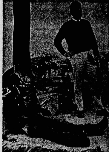
جنگ، اما برای چه کسی؟

این رقابت‌ها منجر به افزایش تولیدات تسلیحاتی و تسلیحاتی شده است. کشورهای جهان سوم به دلیل نیاز به امنیت و دفاع، خریداران مهمی برای تسلیحات هستند. این امر به کشورهای تولیدکننده تسلیحات سود زیادی رسانده است.