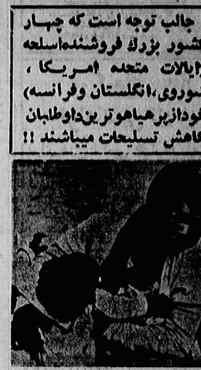
جنگ، اما برای چه کسی؟

آلمان غربی به یک ابرقدرت تبدیل شده است که در رقابت با آمریکا و شوروی قرار گرفته است. این کشور به دلیل اقتصاد قوی و تکنولوژی پیشرفته، نقش مهمی در جهان ایفا می‌کند. آلمان غربی به یک ابرقدرت تبدیل شده است که در رقابت با آمریکا و شوروی قرار گرفته است.