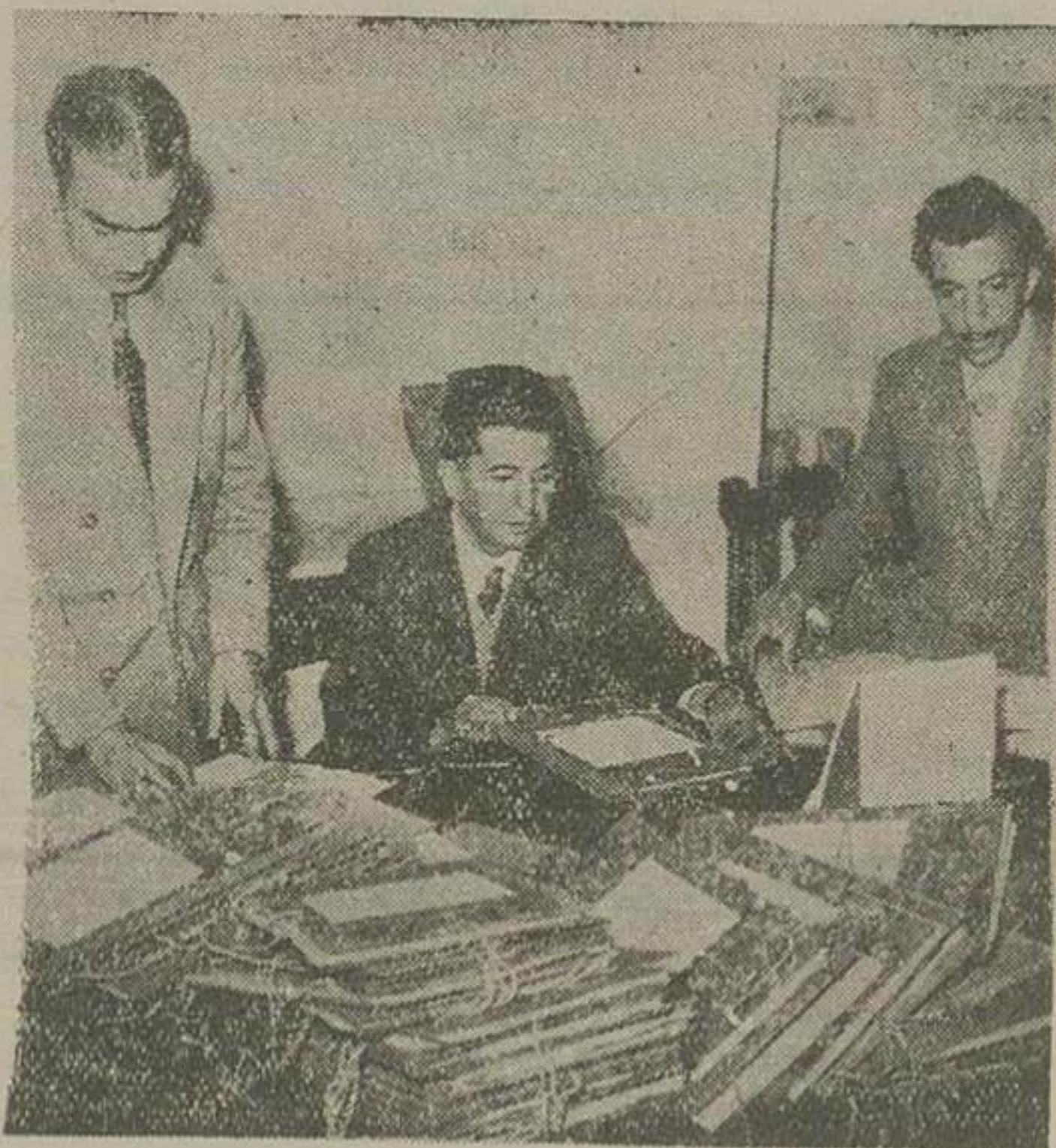
متصدیان ادارات مربوطه مجلس شورای ملی مشغول شمارش اوراق پرونده های انتخاباتی که امروز وزارت کشور بمجلس شورای ملی ارسال شده بود میباشد