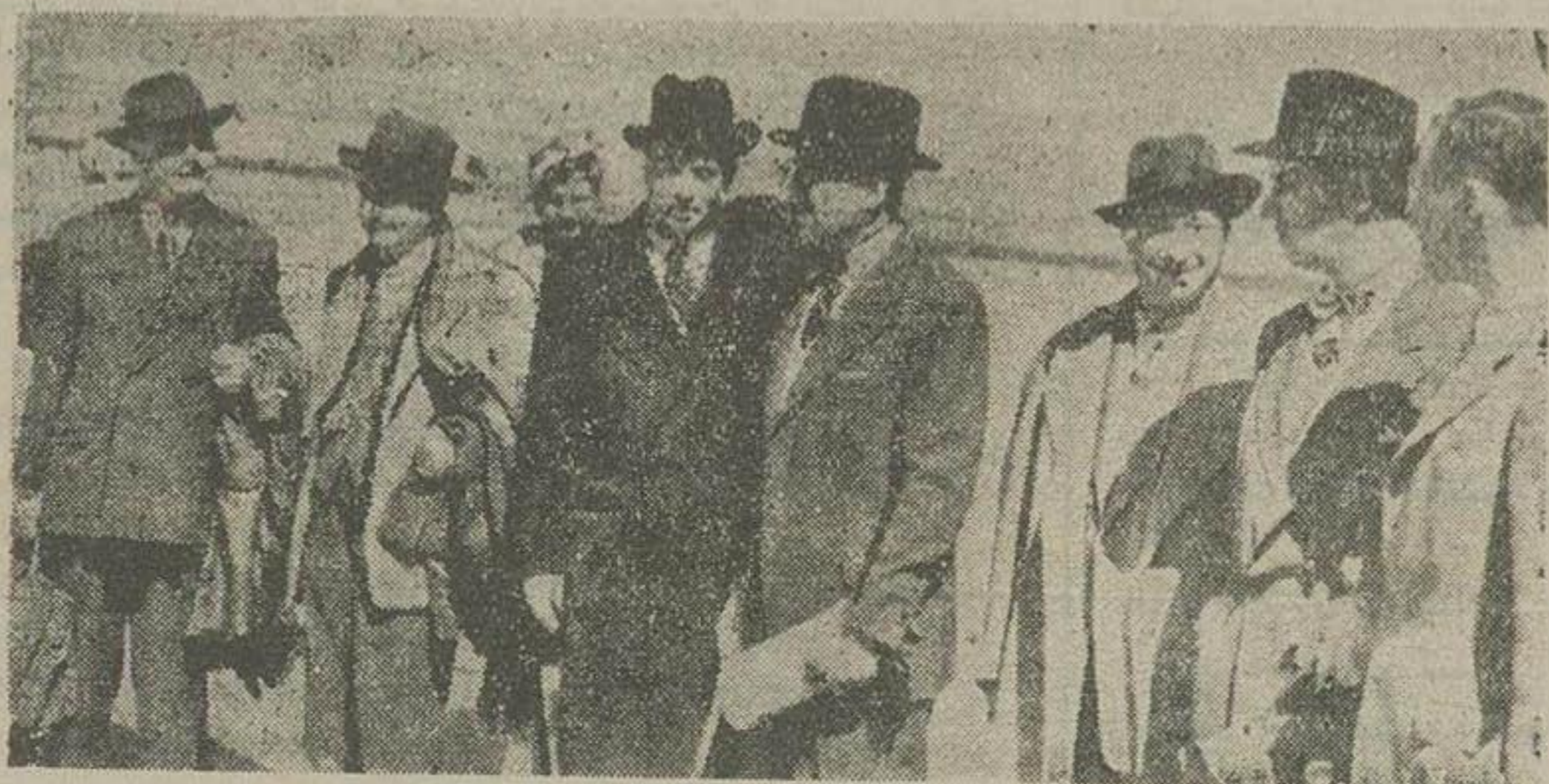
عده ای از دیپلماتهای فرانسوی که دیروز با هوایا بتهران وارد شدند

شانزده نفر دیپلماتهای دولت فرانسه دفتر مخصوص شاهنشاه و ملکه را امضا کردند و سپس دسته گلی ثار آرامگاه اعلیحضرت فقید نمودند اعلامیه سفارت کبیرای فرانسه در تهران در باره مذاکرات کنفرانس