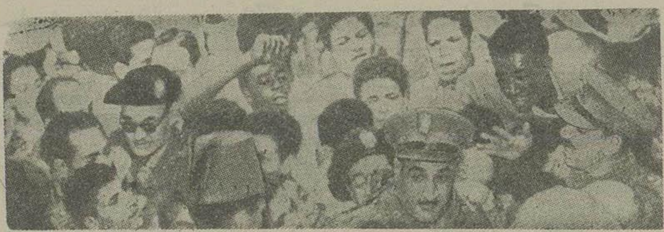
عبدالناصر معاون نخست وزیر و صلاح سالم وزیر هدایت ملی در میان عدهای از تظاهر کنندگان که برله آنها شعار میداد

دیروز وضع شهر قاهره متشنج بود و دستجات مختلف با چوب و سنگ یکدیگر حمله ور شدند و پلیس برای متفرق ساختن جمعیت گاز اشک آور استعمال نمود