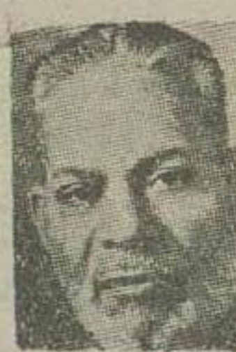
ظفر الله خان

ظفر الله خان وزیر امور خارجه پاکستان در پی انجام مراسم امضای پیمان همکاری بین پاکستان و ترکیه طی یک مصاحبه مطبوعاتی اعلام نمود که برای مطالعه و تعیین حدود و میزان کمک نظامی هینتهائی بین دو کشور مبادله خواهند شد. ظفر الله خان توضیح داد که مفاد این پیمان مطابق با اصول سازمان ملل متحد بوده و هیچوجه با تعهدات و وظایف کنونی دو کشور پاکستان و ترکیه مغایرتی ندارد. وزیر امور خارجه پاکستان سپس توضیح داد که پیمان مذکور دارای هیچگونه مفاد محرمانه‌ای نبوده و این آن در اختیار جراند کادر شده است در پاسخ بسوالی آقای ظفر الله خان اعلام نمود که تاکنون با هیچ کشوری بگری از جمله کشورهای ایران و عراق مذاکرات مقدمه‌ای راجع به الحاق آن کشورها به پیمان ترکیه و پاکستان بعمل نیامده است. همه کشورهای همجوار ما از این موضوع با اطلاعند و فقط بعضی از آنها پرسیده‌اند که این پیمان راجع به چیست