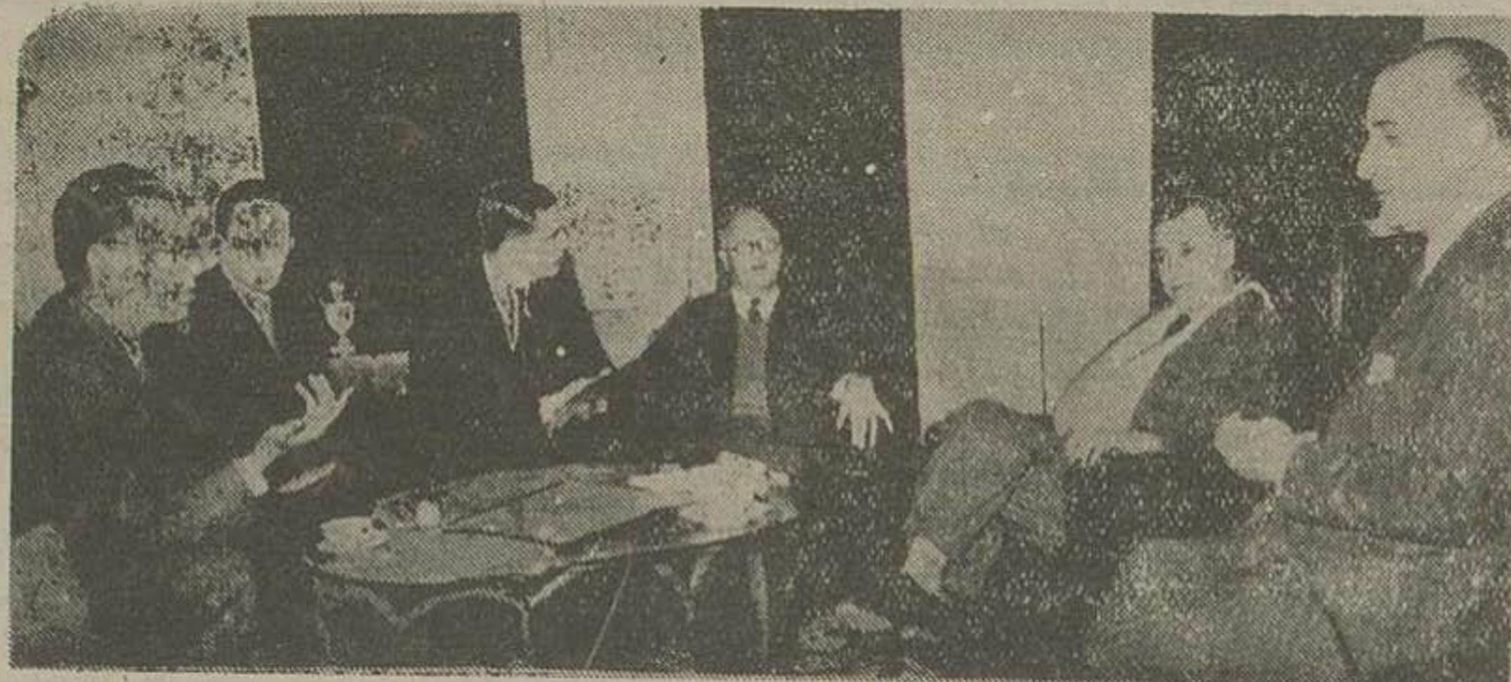
در عکس بالا هیئت نمایندگی مجمع تسلیح اخلاقی با آقایان میهنه و حاذقی در ملاقات با رئیس امور تسلیح و نخست وزیر مشاهده میشوند

هیئت اعزای مجمع تسلیح اخلاقی مدت ده روز در تهران اقامت خواهند داشت و در این مدت با نمایندگان مجمع تسلیح اخلاقی بین المللی ملاقاتهایی بعمل خواهند آورد.