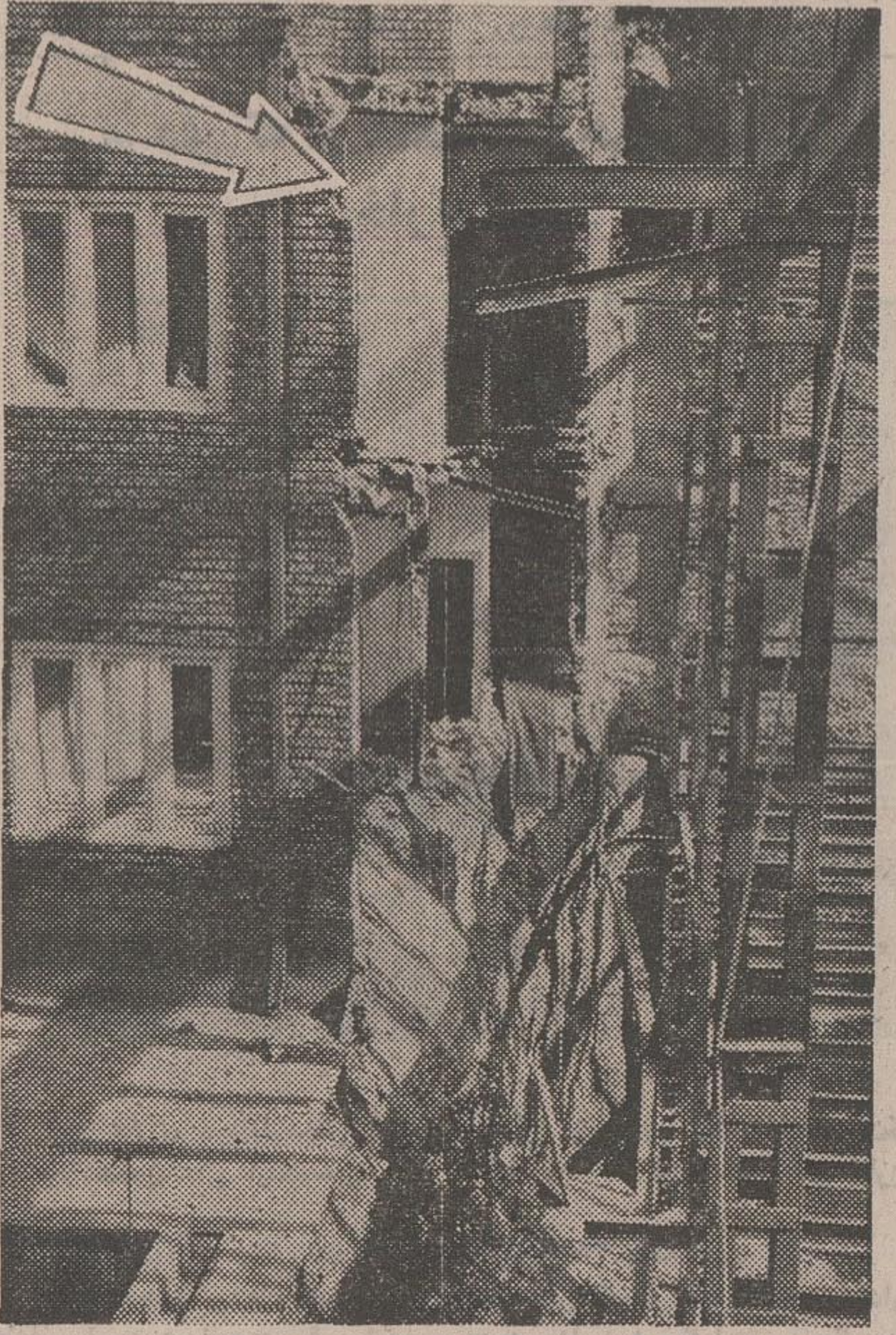
محل که با فلش مشخص شده قبلاً دیواری بود که دیشب فرو ریخت و به مرگ ۲ کارگر منجر شد

برادر گودبرداری غیرقانونی یک زمین برای احداث بنای تازه، شب گذشته دیوار ساختمان مجاور زمین فرو ریخت و دو کارگر که سرگرم استراحت در کنار دیوار بودند، کشته شدند. مالک زمین برای استفاده از فضای بیشتر در ساختمان خود، پس از آنکه گودبرداری به حد مطلوب رسید، به کارگران دستور داد تکیه کوچک در زمینی که بنای مجاور روی آن بنا شده احداث کنند و بقراب اظهار نظر مطلقین همین تجاوز به حریم ساختمان مجاور عدم استفاده از سطح برای نگاهداشتن دیوارها، عامل اصلی بروز حادثه و مرگ دو کارگر است. این زمین و بنای مجاور آن