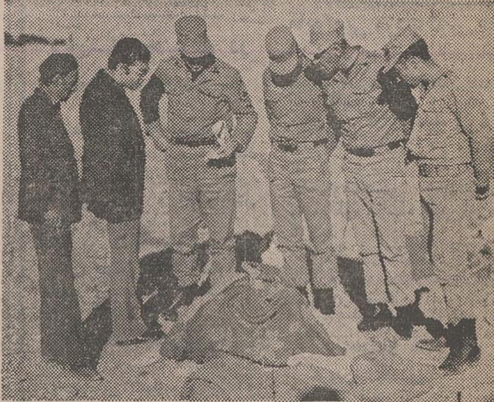
مامورین ژاندارمری پس از آنکه در کیسه را گشودند با جسد زنی جوان روبرو شدند ...

مامورین پاسگاه ژاندارمری اوین ابتدا گمان میکردند محتویات کیسه‌گونی، احتمالاً گوشت قاچاق است، اما وقتی فرشی را باز کردند با جسد بریده زنی جوان روبرو شدند. مامورین این کیسه گونی را هنگام گشت در جاده قدیم فرحزاد پیدا کردند. پس از لمس کیسه گونی، مامورین با توجه به بزمی محتویات آن فکر کردند کیسه محتوی گوشتی است که شخصی آن را بطور قاچاق به تهران می‌برده است. اما وقتی فرشی را باز کردند به زمین افتاده است. اما وقتی در کیسه را گشودند، با حیرت توأم با وحشت دیدند که محتویات کیسه سورتته جدا شده زنی است که در یک بتو پیچیده شده است.