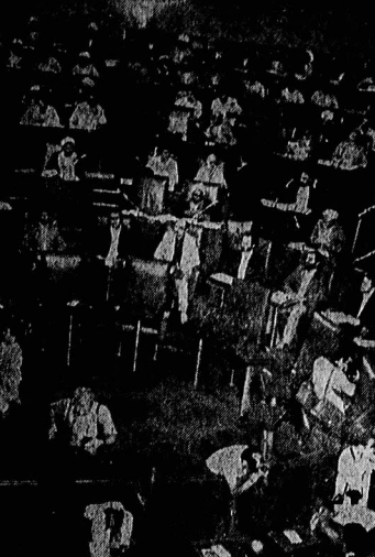
در همین صفحه

نیازمندیهای اطلاعات لفظی آگهی میپذیرد ۳۱۱۰۲۱ - ۸۳ اطلاعیه آستانه قدس شرح در صفحه ۹