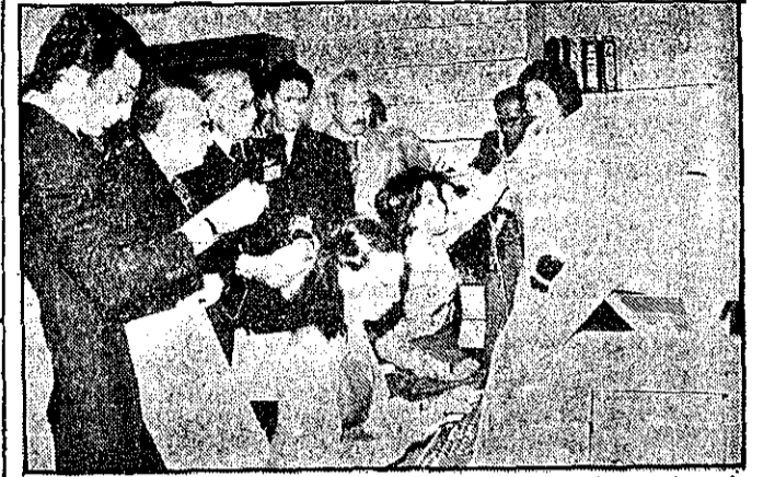
امیرعباس هویدا وزیر دربار شاهنشاهی، در بازدید از مرکز امور فرهنگی دربار شاهنشاهی

امیرعباس هویدا وزیر دربار شاهنشاهی، دیروز از قسمتهای مختلف مرکز امور فرهنگی وزارت دربار شاهنشاهی و کتابخانه پهلوی بازدید کرد.