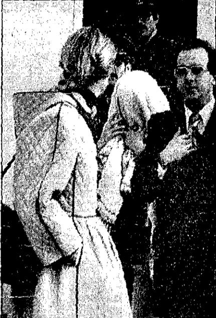
مأموران زن بلژیکی را که صورت خود را پوشانده، به دادسرا میبرند

مأموران برای این خانم پرونده ای تشکیل دادند و او را به دادسرای تهران فرستادند. پرونده خانم بلژیکی بعد از ظهر دیرتر توسط مأموران دادسرای تهران تحت بررسی قرار گرفت و دادیار دستور داد که خانم بلژیکی تحت نظر باشد تا پس از انجام تحقیقات بیشتر صبح امروز او را به دادسرای تهران بفرستند. کارکنان امروز در ادامه تحقیقات گفت: «ممنوعین» هستند. امروز خبرنگار حسودات کیهان گزارش داد که شماره تلفنی که گفته میشود مربوط به صاحب الماسهاست در اختیار مأموران پلیس قرار گرفته است تا روشن شود مربوط به چه کسی است. اسمی از یکی از ایرانیان نیز توسط خانم بلژیکی در اختیار مأموران قرار داده شده است که احتمال می رود به دستگیری این شخص روشن شود. الماسها متعلق به چه کسی است، براساس گزارش خبرنگار حوادث کیهان ارزش الماسهای کشف شده بیش از ۱۷ میلیون ریال است و معادل همین مقدار هم جرمه الماسها کشف شده است. تحقیق درمورد این ماجرا از طرف مأموران پلیس ادامه دارد.