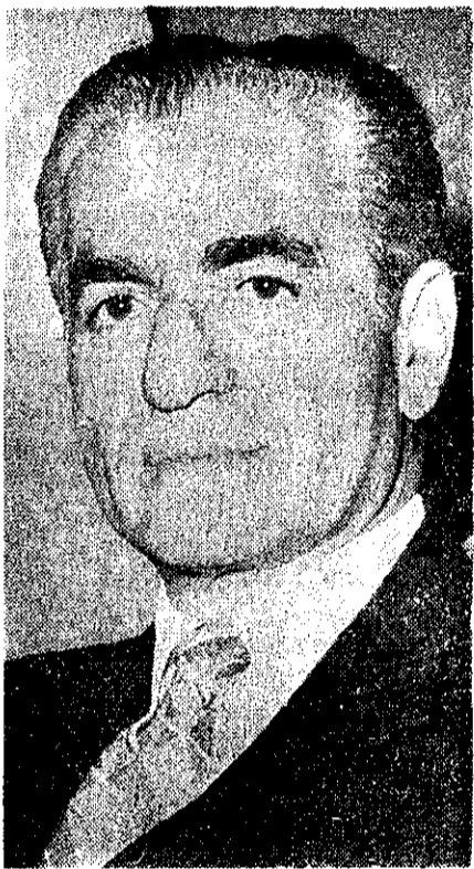
شاهنشاه: در این راه سرنوشت تا آخرین روز پیشاپیشی شما خواهیم بود

شاهنشاه مطالب تازه ای درباره دکتر مصدق، مبارزات نفت و حزب ایران فاش کردند