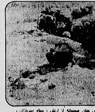
می بینیم بیوهه نیست که امام در سخنان دیروز خویش جهان صمیمانه از ارتش ، سپاه سوزازان ، پاسداران و داوطلبان رزمنده سپاسگزاری میکند دلایران پاکبخت مینمان را می بینید که چه غارغ از هر اختلاف و نزاعی زیر آتش گوله و خمپاره می جویند و بر دشمنان شایخون میزند.

● دیروز ۵۱ دستگاه دشمن در جبهه سوسنگرد منهدم شد. ● یک فروند هلیکوپتر دشمن در منطقه جنگی محصور سوسنگرد اهواز به دست فرماندهان پاسداران افتاد. ● شهر سوسنگرد در محاصره تانکهای دشمن قرار گرفته است. ● مواضع توخانه و انبار مهمات لیبویاهی بی در جنوب غربی اهواز به آتش کشیده شد. ● در جبهه شمال شرقی توخانه بهشتراز شدت آتش دشمن کاسته شده است. ● دیروز نبرد در جبهه های سر بل زهاب ، گلستان و سواحل بطور بارگشته سا آتش توخانه ادامه داشته است. ● در جنوب مواضع خودروها و فرات دشمن در جبهه های غرب نابود شدند. ● در جنوب مواضع دشمن تجاوز در نواز مرزی سواحل زهاب و قصر حسین دیروز زیر آتش توخانه ایران قرار گرفت. ● در جنوب غرب دیروز یک سکوای موشک انداز و یک تانکهای سکوای موشک سام و ۵۰ مزدور عراقی نوسه دوزان هوا نورد نابود شدند