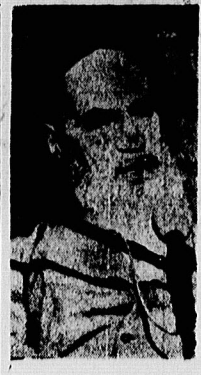
آنهایی که در موقع جنگ اجتماع می کنند و حرف مفت می زنند اگر دشمن غلبه کند اولی در شما را درمی آورد در صفحات ۱۱ و ۱۲