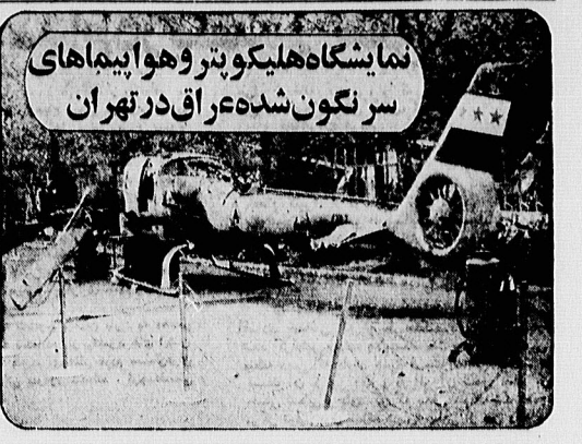
نمایشگاه هلیکوپتر و هواپیماهای سرنگون شده در آق در تهران