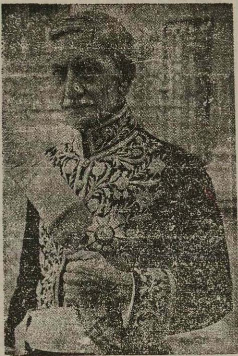
آقای حکیم (حکیم الملک) نخست وزیر قبل از شرفیابی در کاخ گلستان

رژه دهندگان پس از عبور از برابر شاهنشاه، در خیابانهای شهر براه افتاد، و از خیابانهای لاله زار - اسلامبول - نادری - چهار راه - قیبه در صفحه ششم