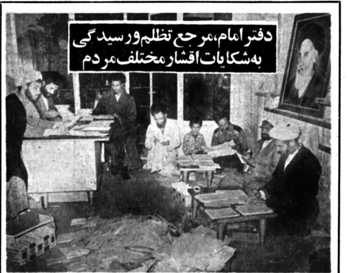
این گوشه‌ای از دفتر امام خمینی در قم است. روزانه هزاران هزارانه ، شکایت‌تظلم ، بیست‌هفتاد و نفلانی آن به‌این دفتر می‌رسد و متصدیان آن بصورتی خستگی‌ناپذیر به‌این انبوه نامه ها رسیدگی می‌کنند

حضرت آیت الله خواهان رسیدگی به ماجرای ربوده شدن امام موسی صدر ، موضوع فلسطین و مسلمانان افغانستان شدند در صفحه ۱۱