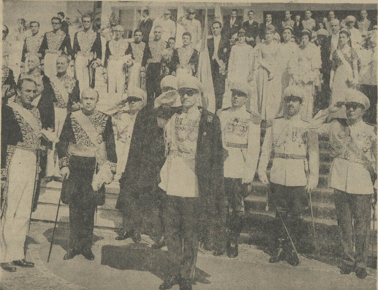
هنگام تشریف فرمائی شاهنشاه آریامهر به کاخ سنا تشریفات نظامی بعمل آمد و مارش سلام نواخته شد. در عکس بالا آقایان نخست‌وزیر، وزیر دربار و در ریف بالا بوری‌پلکان والاحضرت شاهدخت شهبانز پهلوی، والاحضرت شاهدخت شمس پهلوی، والاحضرت شاهدخت اشرف پهلوی، والاحضرت شاهدخت قاسمه پهلوی، والاحضرت روزا پهلوی و والاحضرت شاهرور احمد رضا و آقایان وزراء و روسای دربار شاهنشاهی دیده میشوند.

از خداوند متعال مسئلت داریم که کشور و ملت کنشسال ما را مانند همیشه در پناه لطف و عنایت کامله خویش از هر گزند و آسیبی درآمان بدارد، و همیشه ما امکان آن بدهد که با کار و کوشش بر اساس انقلابی که منطبق با عالیترین سنن و موازین معنوی اسلامی در کشور ما صورت گرفته است جامعه‌ای از هر جهت آزاد و آباد و سعادتمند بوجود آوریم، و در این راه توفیق همگی شما نمایندگان ملت را در این دوره تقنینیه در انجام وظیفه خطری که در برابر ملت ایران بعهده دارید خواستاریم.