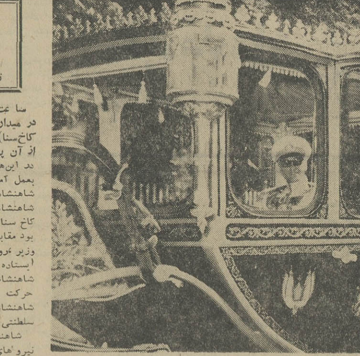
شاهنشاه آریامهر با کالسکه سلطنتی به کاخ سنا تشریف فرما شدند، اسواران سوار کالسکه سلطنتی را همراهی میکردند و مردم در دو طرف مسیر ملوکانه نسبت به شاهنشاه آریامهر ایزاز احساسات میکردند

ساعت ۹ و ۵ دقیقه کالسکه سلطنتی دولت ادای احترام کردند. در سرسرای کاخ سنا امرای ارتش شاهنشاهی ادای احترام نمودند و شاهنشاه و اعضای خاندان سلطنت باطاق مخصوص تشریف فرما شدند. در ساعت ۹ و ۲۰ دقیقه تک مجلس نواخته شد و سناتور ها و نمایندگان مجلس شورایی و سایر مدعیون به مجلس شورا باقی ماندند. مدعیون تالار جلسه را همنائی شدند. مدعیون عیادت بودند از: نصحت‌وزیران و وزیران سابق، سفراء استناداران سابق، روسای سیاسی، استادان دانشگاه، روسای دانشکده‌ها، روسای دیوان کشور، قضات روسای ادارات و بانکها، اعضای احاطق های صنایع و بازرگانی، کانون وکلا دروزنامه نگاران، مدعیون به تریب بالکن‌های سنادا اشغال کرده بودند. تالار جلسه نمایندگان دو مجلس، اعضای هیئت‌جولت، معاونین نخست‌وزیر،