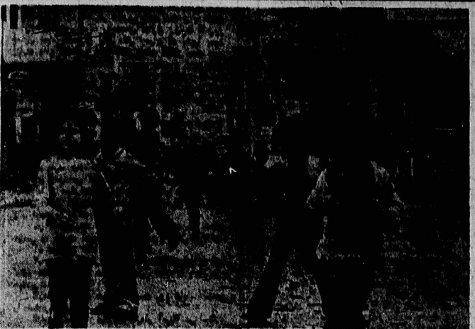
گولاگان لبنانی، این فریبان توطئه‌های جانبگراانه امپریالیسم امریکانو صهیونیسم‌جهانی، دردنایا صادقانه‌شان، نگاه به آینده دوخته‌اند. از آنجا که حق ماندنی و باطل رفتنی است، سرانجام امپریالیسم جهانی صهیونیسم‌جهانی‌کنار مطلوب فخر مستغنیب جهان شده و برپروزی از آن ملت‌هایمان و مبارز لبنان خواهد بود و این لوبوگان لبنان زندگی نوینی را آغاز خواهند کرد.

توطئه‌های جهانی در لبنان در سؤال فهدم نقش امام موسی صدر در انجام کنفرانس ریاض و سپس قاهره و بالاخره استقرار صلح‌جویان، مورد توجه قرار گرفته است؟