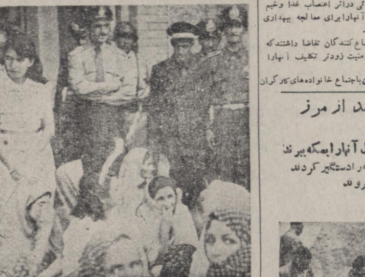
عدهای از خانواده های کارگران زندانی در مقابل فرمانداری اجتماع کرده و تقاضای رفع توقیف اذکارگران را داشتند