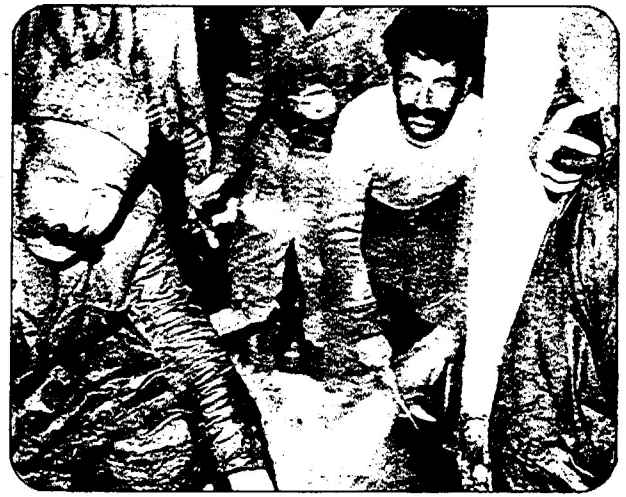
اینجا، اگر برای کشتار دام‌ها بهداشت باشد، برای ما نیست