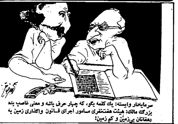
سرمایه دار ایسته: یک کلمه یگو، که چهار حرف باشه و معنی فاضل یله بزرگ مالک: هیئت هفت نفری سامور اجرای قانون واگذاری زمین به دهقانان بی زمین و کم زمین؟

با هم نوشتهها و گفتههای این دهقانان خراسانی را - بمثابة مشقت نمونه خوراک بخوانیم و به سرچشمه نیروی زوال ناپذیر انقلاب - که اگر به زحمتکشان متکی شود و منافع حقه آنها را برآورده سازد، شکست ناپذیر خواهد بود - بار دیگر بی ببریم.