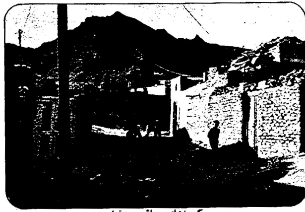
کوچه‌های محله سعیدآباد

متأسفانه قاچاقچیان مواد مخدر نیز، با استفاده از محرومیت‌های بیشمار ساکنین این محله، شدیداً فعالیت دارند، که این هم مشکل بزرگی است. مأموران از مسئولین امر در استان سیستان و