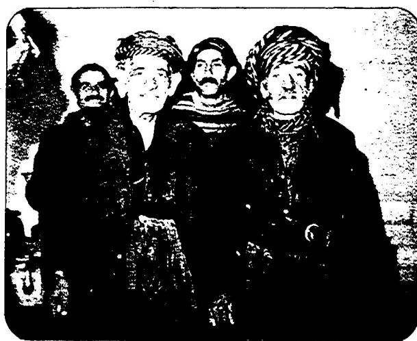
پیرشده است - اما از بام تا شام کار میکند

سلاخان که کرمانشاه، که کشتار کلیه دام‌های مورد نیاز شهر را به عهده دارد، در کشتارگاه خانه قهره سو قرار دارد. در این سلاخان حدود دویست نفر به کار فصولاتی کم‌ساز کشتار باقی می‌ماند، به رودخانه قهره سو ریخته می‌شود و محیط اطراف آن را به تعفن می‌کشاند. برای آشنائی با وضع کارگران با آنها به گفتگو نشستیم یکی از آنها گفت: اینجا کار می‌کنم، آن زمان است هیچ ساختمانی غیر از کشتارگاه در اینجا وجود نداشت. ما هر روز صبح سحر با چراغ در پها بان‌ها مدتی راه می‌رفتیم، تا به سرکار برسیم. با این همه فعالیت ما،