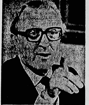
لرد کریکتون، در تلاش برای مطرح نمودن دوباره انگلستان انگلیسی‌ها آنها را «خوشه میبدانه، روی میبدانه، چرا در انگلستان روی میبدانه» فرد کریکتون، باید شادمان باشد که وزیر کشور نیست، دست کم او میباید همچنان به ارباب بگوید که اتحاد شوروی، خطر واقعی برای آنهاست. اما اگر آمریکا تقویت تسلیحات را با خودباندان انگلیسی‌شان آسان کند، کریکتون، ممکن است نسا در گوئی ارباب و دیگران نباشد که انگلیس استکبار است فرستگانی نباشد که او اول میبنداشد.

می گوید که هند پاکستان چه کرده است. احوالات همچین سلاح‌ها را برای هر کس در خاورمیانه و خاصه برای عربستان سعودی، اسرائیل و مصر تامین کرده است تا آنها را طبع خطر شوروی تعبیر کند. اتحاد شوروی درک می کند که احوالات منتهی باید جنگ افزارهای خود را برای پاریس بفرستد. بفرود پادگاه کند. همانگونه که آمریکا باید کاره های مازان را داشته کند. صنایع تسلیحاتی احوالات منتهی باید بازار دارد. ایران پیش از انقلاب، هرسال تقریباً ۲۰ میلیارد دلار برای خرید تسلیحات در احوالات منتهی خرج می کرد. هریستان سعودی اکنون پشتیبان کسری در آمد تسلیحاتی آمریکا در جهان کرده است. حتی اتحاد شوروی که تصور می شود خطر بزرگی برای خاورمیانه باشد، می گوید جنگ افزارهای اروپایانه بفرستد. بکجا که بکجا میباید برای انجام ماموریت خرید تسلیحاتی در اتحاد شوروی بفرستد. اتحاد شوروی آموخته است که از لحاظ تامین جنگ افزار برای مازان، های آمریکا، مانند هریستان سعودی و پاکستان، زیاد نگران نشود. احوالات منتهی از این لحاظ کما کما سفارشات تسلیحاتی میبنداشد خود را بدون توجه به منافع اقتصادی میبند، میبند. خود خواهانه رفتار کرده است. دست کم بخشی از رزود در انگلستان را، لرد سفارشات تسلیحاتی میبنداشد است که شاه سرگون شده ایران به انگلستان سفارش داده بود. اما فعلاً، شاه هریستان سعودی، اخیراً در لندن بوده است و گزارش داده میبند که در دسترس است. انگلیسی‌ها میبند در این صنایع انگلستان داده است. اما سفارش مانند بیابانستان، هنر، و دیگر کالاهای نرزه به دست میبند، باورند، اما آنکه آمریکا کشتارهای بزرگ را پس از ارسال جنگ افزارها انجام میبندند.