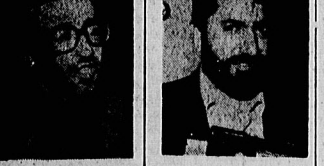
مجلس سومی وزیر است و تفکرات و نظن

نخست وزیر ضمن اظهار نظر در باره سفر حبیب و همسر او به منطقه انفجار بپ در دمشق و آمدن محکوم کرد