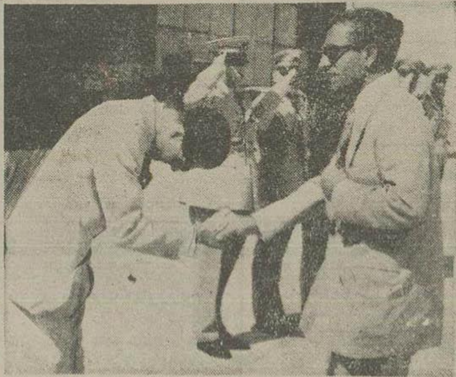
علیحضرت همایونی پس از نزول اجلال تهران در فرودگاه مهرآباد نسبت به والاحضرت شاهی و عبدالرضا ابراز تقدیم میفرمایند

سفیر کبیر ایتالیا استوارنامه خود را در کاخ سعدآباد پیشگاه ملوگانه تقدیم کرد آقای نخست وزیر برای عرض گزارشی امروجراری کشور شرفیاب شد.