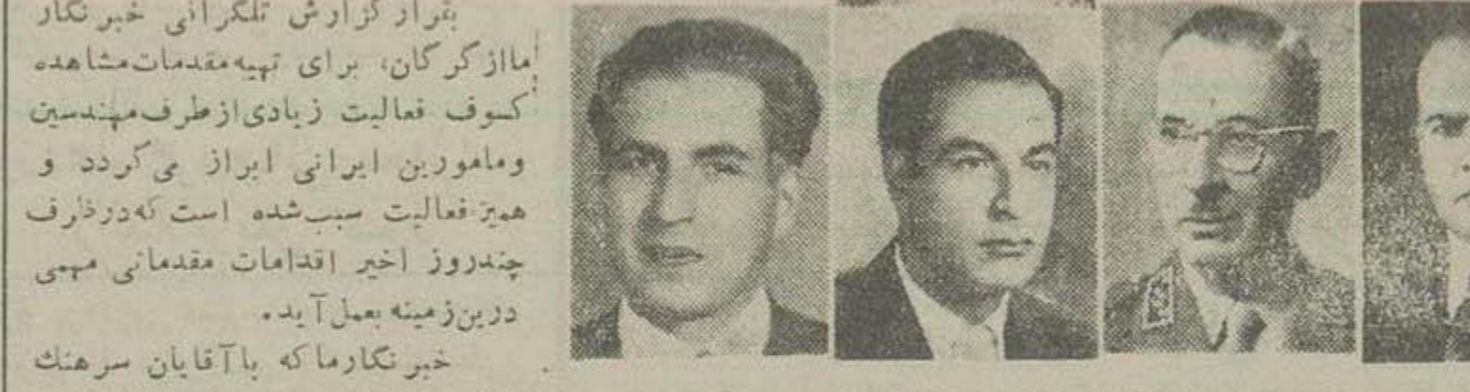
دکتر ریاضی سرتیپ رزم آرا مهندس کنگار محمد آربین

دانشمندان امریکائی و ایرانی در ۱۲ کیلومتری گران پامیگرود