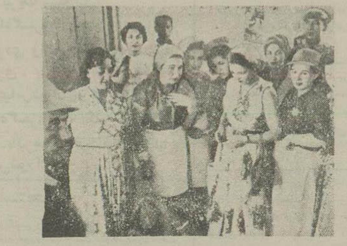
هیئت بانوان اعزای از طرف جمعیت خیریه ثریا پهلوی وضع آوارگان سیل را بازدید میکنند