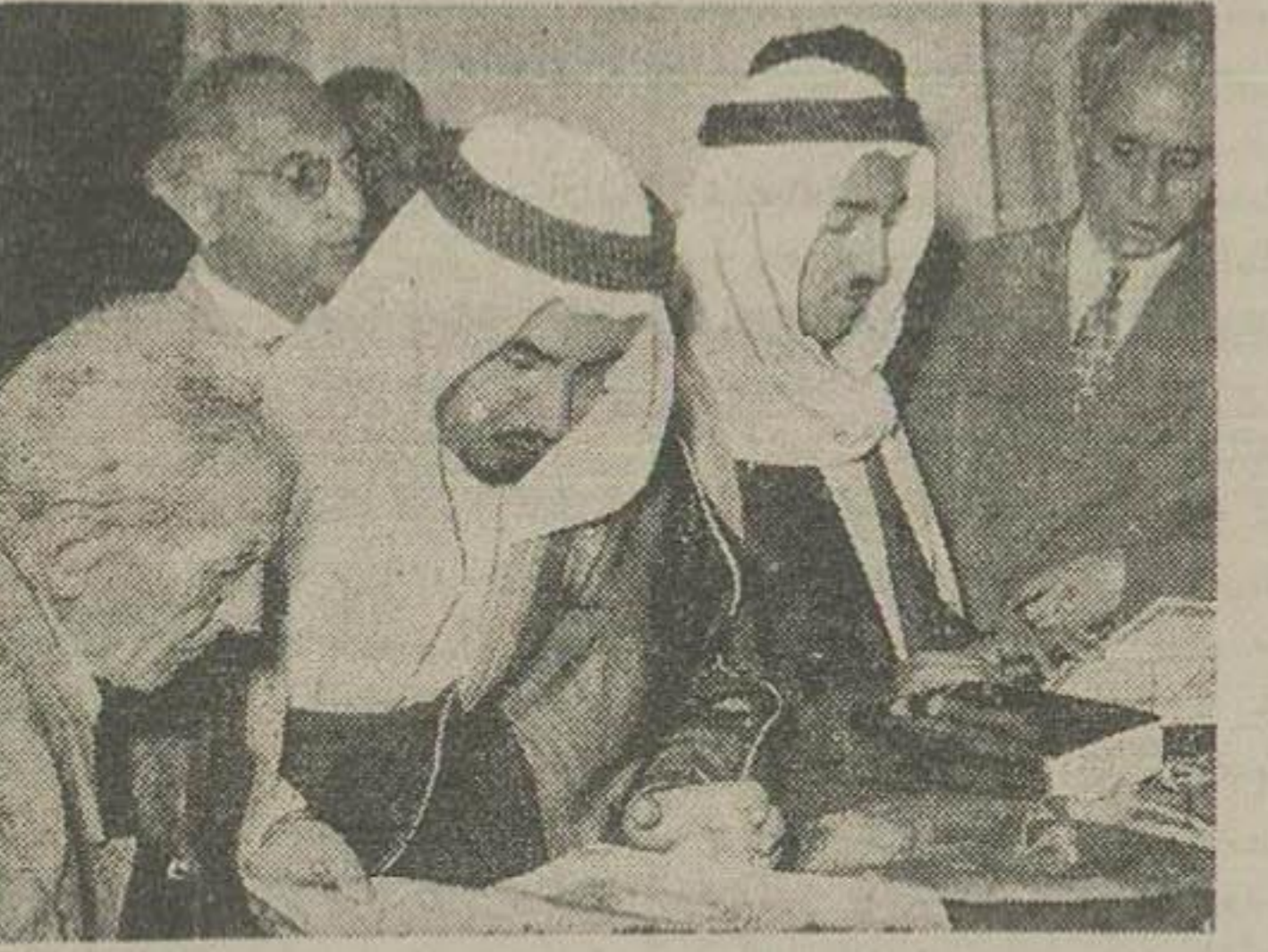
شیوخ کویت هنگام بازدید کتب خطی کتابخانه مجلس دیده میشوند بر حسب وقتی که تعیین شده بود امروز ساعت ۸ نیم صبح آقای شیخ جابر آل صباح چنانچه امیر کویت با تفاق همراهان خود در مجلس شورای ملی حضور یافت و از آقای سردار فاخر حکمت رئیس مجلس ملاقات و صرفنچای نمود و سپس کتابخانه و تالار جلسه علمی و تالار آئینه و سایر تاسیسات مجلس را تماش نمودند.

شیوخ کویت از رئیس مجلس دیدن نمودند و عمارت مجلس را بازدید کردند