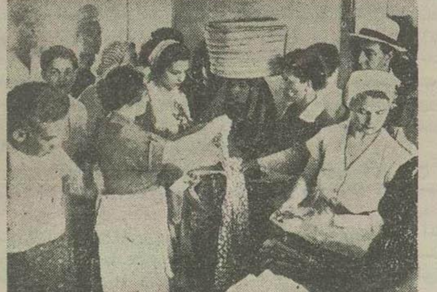
خانم آقای نخست وزیر و سایر بانوان اعزای بخرم شهر هشتام توزیع پارچه و لباس بین سیزده زن کان دیده میشوند

فعالیت هیئت اعزای از طرف جمعیت خیریه ثریا پهلوی در آبادان تأثیر نیکوتی در روحیه اهالی آبادان و خرمشهر نمود همسر نخست وزیر و همراهان نافردا در خرمشهر توقف خواهند داشت گزارش اقدامات هیئت اعزای بعرض علیاحضرت ملکه خواهد رسید