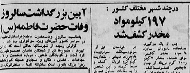
در چند شهر مختلف کشور : ۱۹۷ کیلومواد مخدر کشف شد

بیت الله انحصاری منتظر در اجتماع نماز گزاران لم یادگی ابرو کی میتواند بر منابع ومخازن ایران دست