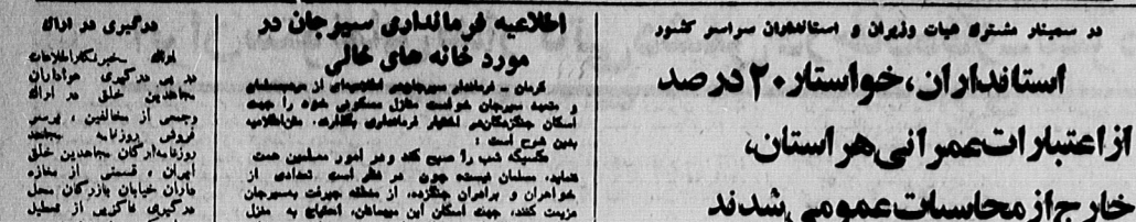
اقتصادی و اجتماعی بخش های وزیران و استانداران

آیین بزرگ گداشت سالروز وفات حضرت فاطمه (س)