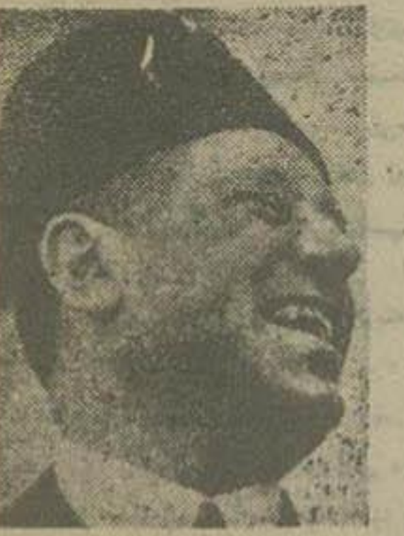
حسونا پاشا وزیر خارجه مصر

مذاکرات مقدماتی میان مصر و انگلستان با توافق در مسائل کلی خاتمه یافته است امریکا در مذاکرات مربوط بدفاع مشترک، شرکت میکند انگلیسها ده میلیون لیره مصری در بانک لندن در اختیار مصر گذاشتند