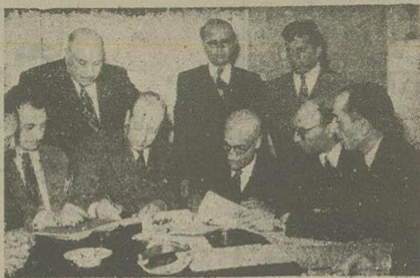
قرارداد تاسیس کارخانه شیر پاستوریزه در تهران امضا شد

در ملاقاتی که صبح امروز خبرنگار ما با یکی از مقامات مسئول وزارت دارائی بعمل آورد سوال کرد: با اینکه صورت برداری از خانواده هادر تهران در اواخر اسفندماه خاتمه یافت علت اینکه تاکنون کارتهای قند و شکر توزیع نشده چیست؟ مقام مزبور جواب داد: دو مشکل پیش آمده که تاکنون توزیع کارت های قند و شکر را بناچار انداخته است. در مرحله اول اختلاف پیشه وران با وزارت دارائی که بایستی آنرا مشکل اصلی دانست. باین معنی که در اوایل امر که مصرف قند و شکر راهالی تهران بوسیله عاملین فروش توزیع میگردد فقط ۶۰۰ نفر اعلام کرده اند و در تهران وجود داشته که احتیاجات روزانه مردم را تقسیم میکردند ولی بدینست با افزایش جمعیت و کثرت احتیاجات و تقاضاهاییکه از طرف مردم میشد تا اواخر سال ۲۹ تعداد عاملین فروش تدریجا به ۱۲۰۰ نفر بالغ شد ماهیانه در حدود ۳ تا ۳ هزار پوندمتدی قند و شکر بصورت سهمیه هفتگی و ۱۵ روزه با ناهنجاری بگردید.