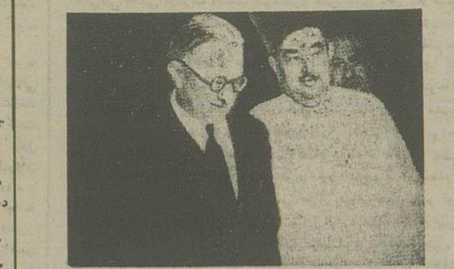
صلاح الدین بابکوش نخست وزیر تونس با آقای ژنرال دونکلوک کبیر عالی فرانسه در تونس

بیروت - آسوشیتد پرس - وزیر کشور لبنان دیروز بجزیرگان گفت که در نظراسر عمده ای از آوارگان عرب را بحیرین و کویت منتقل کند. یک سخنوری وزارت خارجه گفت که در این باره هنوز تصمیم قطعی اتخاذ نشده ولی چون جمعیت لبنان روز بروز در حال افزایش است، لذا دولت لبنان با انتقال عمده ای از آوارگان بمناطق نفت خیز عراق و کویت و بحیرین موافق است.