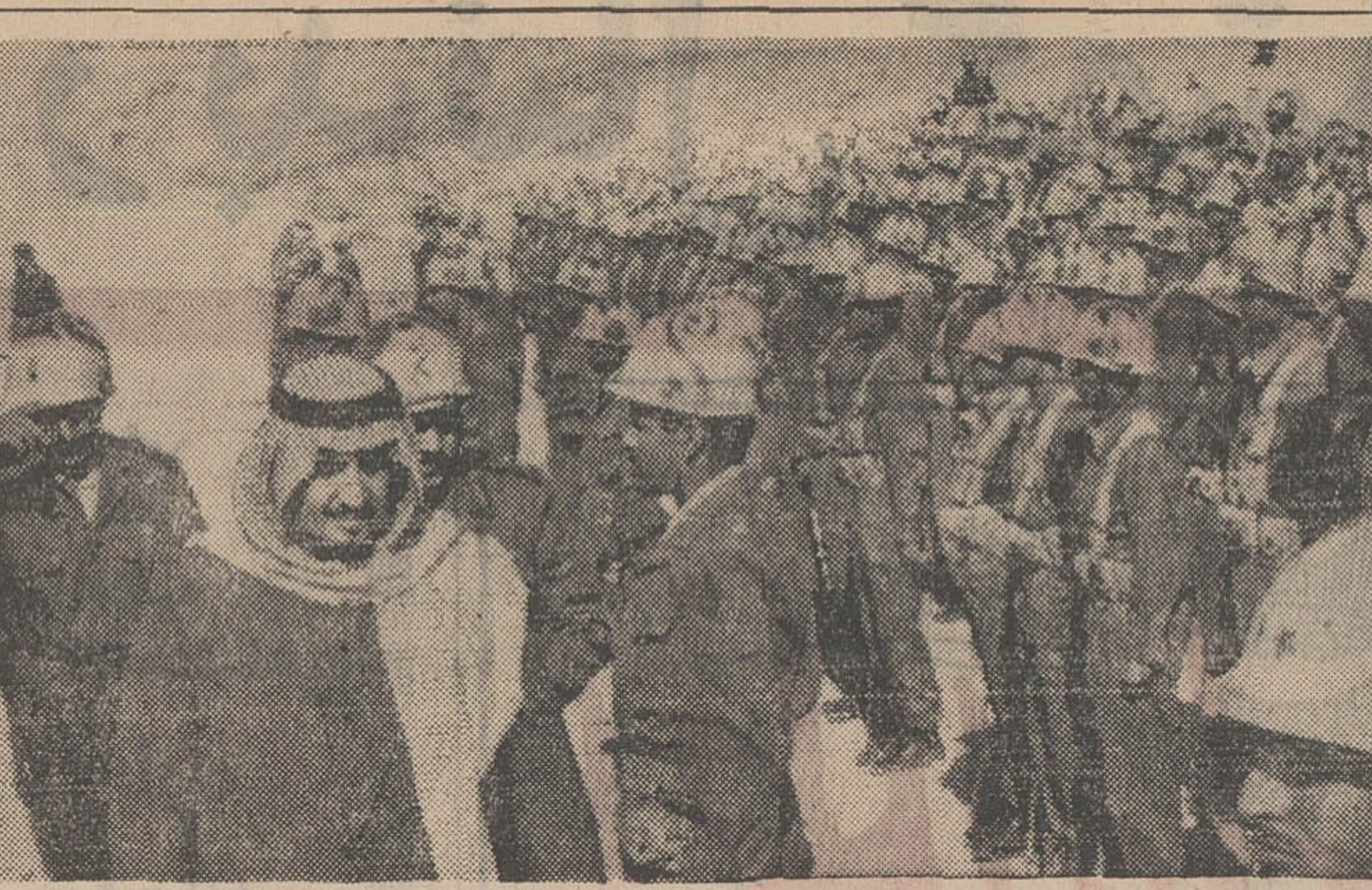
پرس امیر سلطان عبدالعزیز وزیر دفاع عربستان سعودی دیروز ضمن بازدید از نیروهای عربستان که در مرز اردن و اسرائیل مستقر هستند قول داده که این نیروها را افزایش دهد و قدرت آتش آنها را زیادتر کند.

وزیر امور خارجه لبنان در یک مصاحبه مطبوعاتی به خبرنگارخبرگزاری خاور میانه اظهار داشت که سفر رشید کرامی در چهار چوب مأموریتی که کابینه معینده او خود من واکتدار کرده انجام گرفته است.