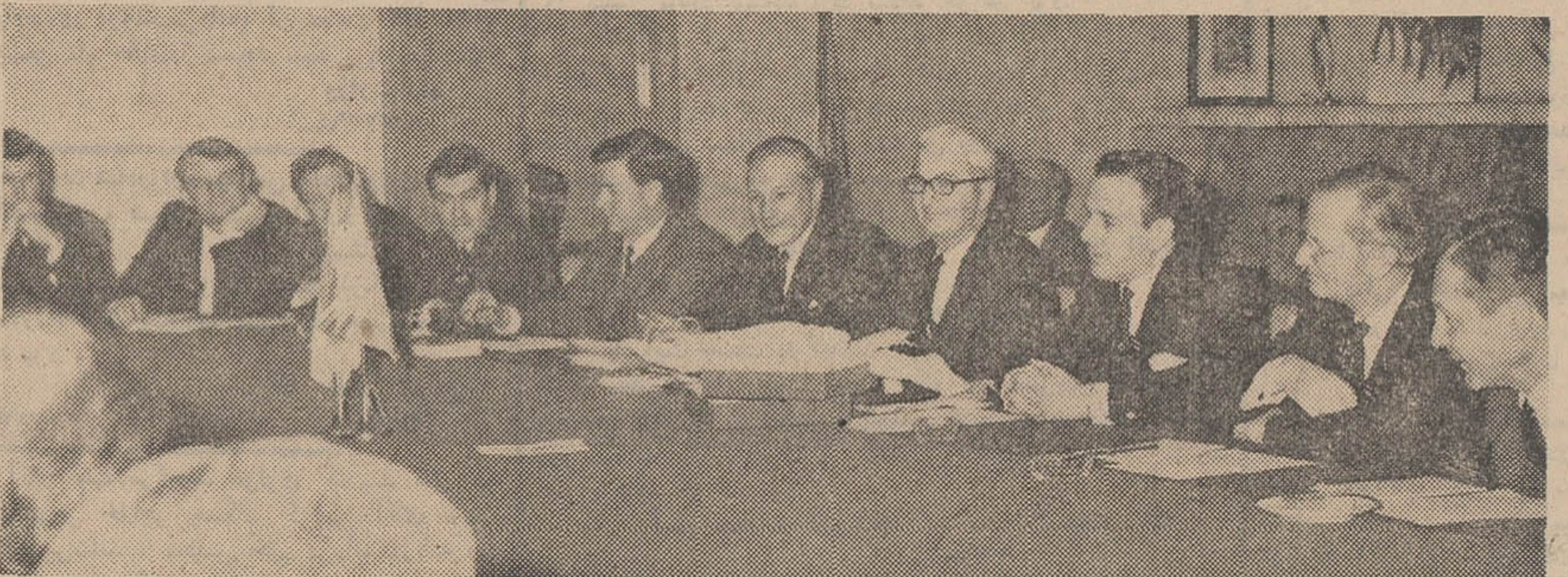
اعضای هیئت اطلاع بازرگانی لندن در جلسه مذاکره با بازرگانان ایرانی.

در جلسه مشترک صاحبان صنایع و بازرگانان دو کشور مورد بررسی قرار گرفت