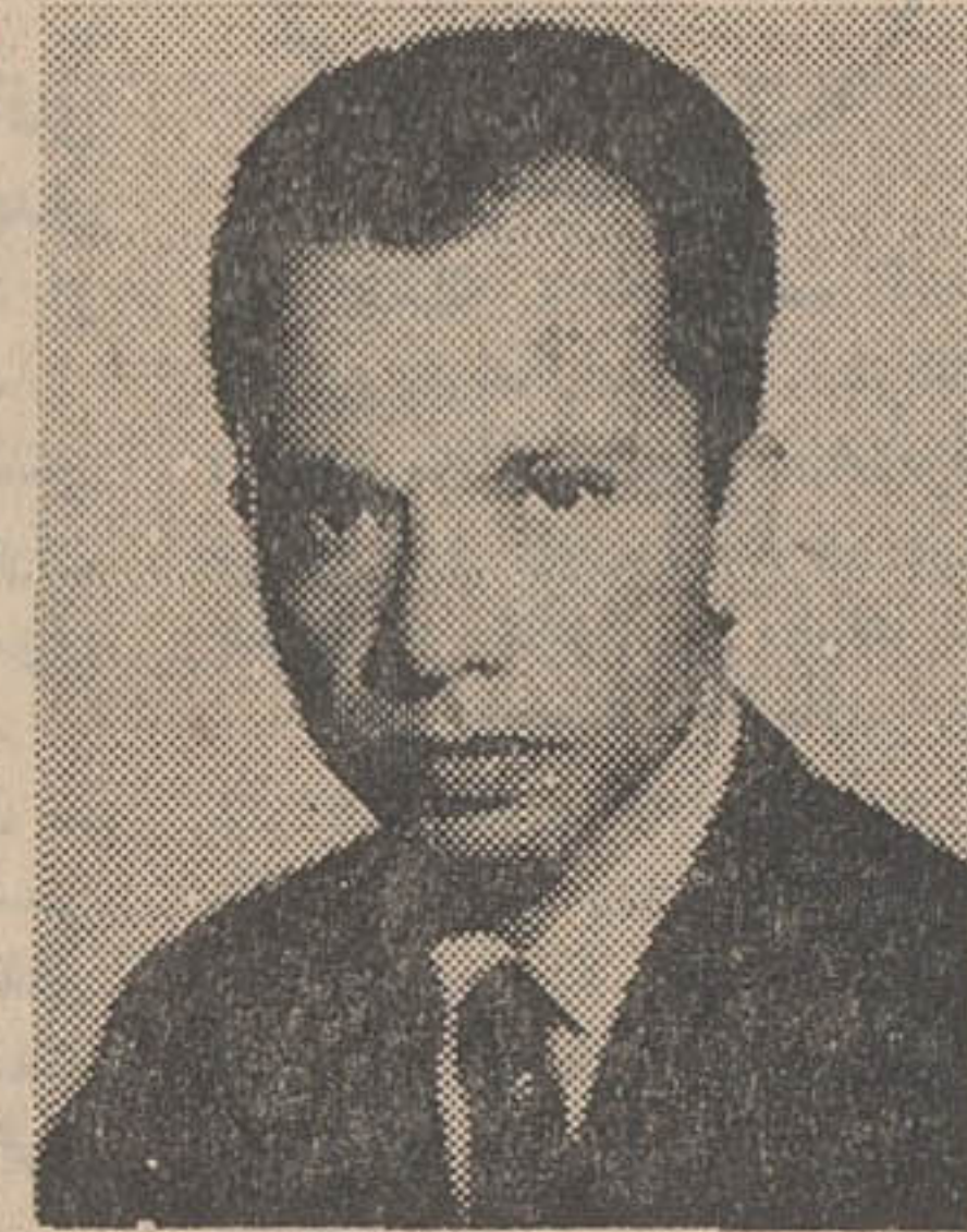
آقای جلیل شرکت

تشکیل شرکت های صادراتی برای افزایش صادرات ضروری است برای توسعه صادرات با بخش خصوصی همکاری خواهد شد که پس از مدتی روی پای خود بایستند