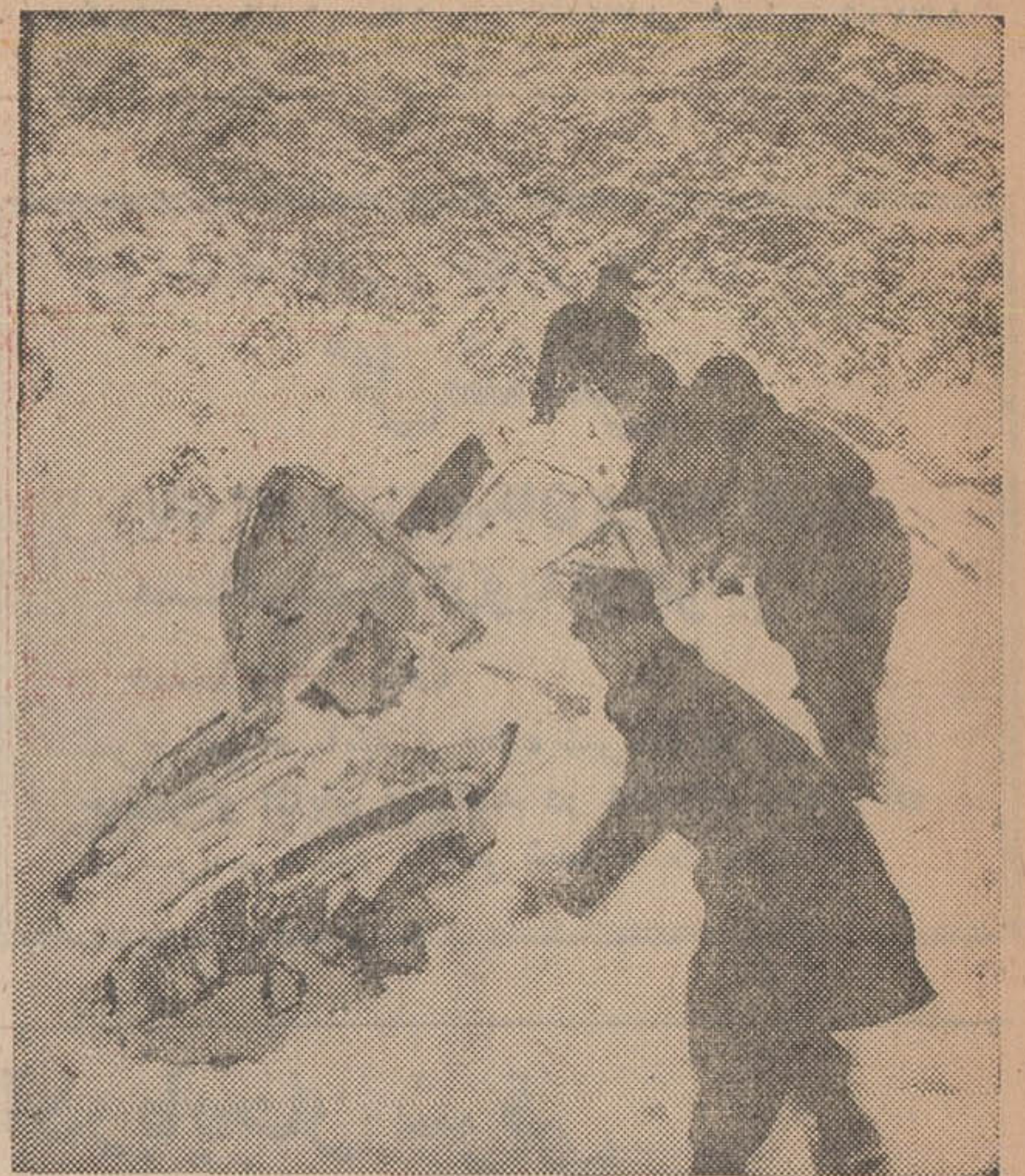
در این عکس چند نفر از سرانجام باقردهای رفته‌اند که به سر- نشینان اتمییل سرنگون شده، در صورتی که زنده باشند کمک کنند تا اینکه جدا آنها را بیرون بکنند.