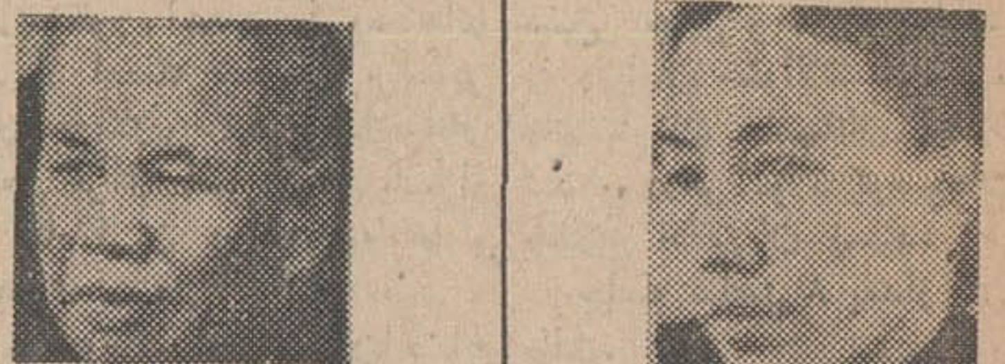
Portrait of a man, likely a representative of the North Vietnamese delegation.

تخلیه بار «قطر جگان» نوشته: هیئت نمایندگی ویتنام شمالی