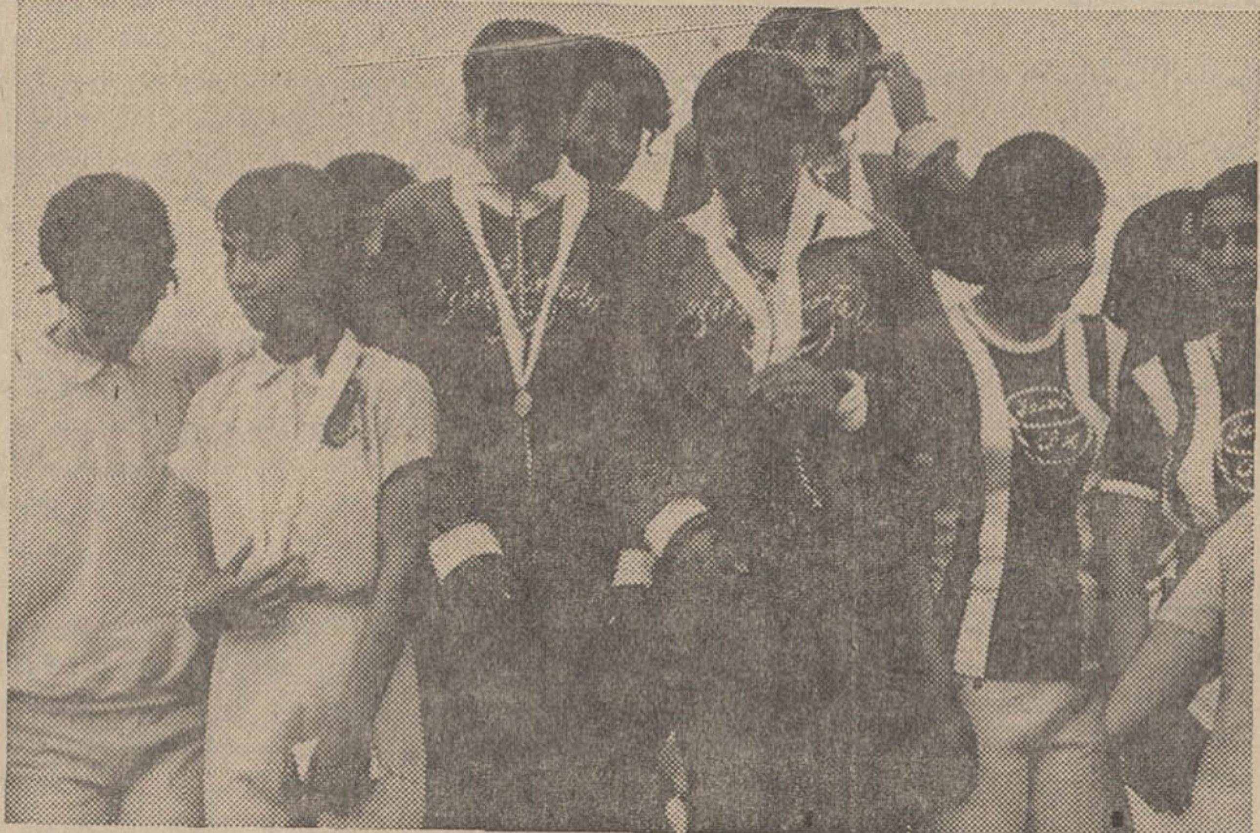
مسابقه دو ۱۰۰۰ متری تیمی دختران فرمانداریهای کل بایروری دختران لرستان پایان رسید.