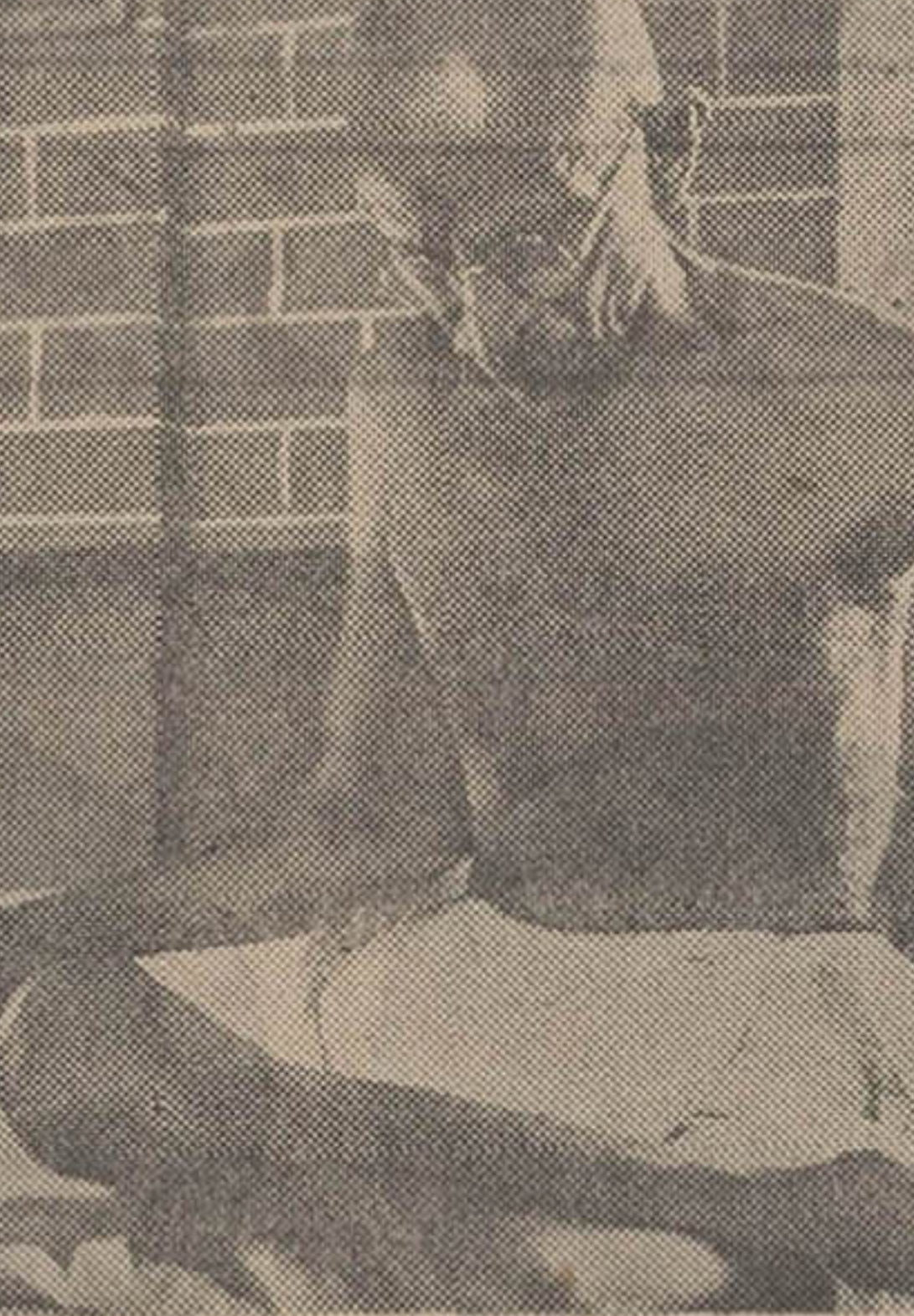
گاندی، رهبر بزرگ مردم هند... مردمی که با تلگرافی ملت خود را برای بی نیازی از منسوجات خارجی و دهانی از قید استعمار برهبری کرد!

پی خیری ناشی از سانسور دلیل واضحی است که وضع هندوستان بیره و بدرهم است و فضای میموری میدهد. آنچه محقق است و میتوان گفت که این است که رفتار طرفداران گاندی ارجح است عدم تهاجم تجار و نوپه و تبدیل پانزده و خودر حقیقی شده است. پیراهن سرخها پیشانی مردم فرار گرفته وبر علیه نواب است که بمباران مشغول و بیم اندازی میبندند و چندین نفر از سربازان پیاده نظام انگلیسی در این کمپشکس بتل رسیده اند در نتیجه این جان ناسر یعاقوبی امدادی از طرف دولت انگلستان فرستاده شد. در این جا به یانکته دقیق بر میخوریم و آن استقامت دولت انگلیسی میباشد در سر کوبی انقلابیون یا استلال - طلبان و زیرا بجای اینکه سربازان خود را احضار یا قسمتی از آنها را به تقسیم کنونی وادار کنند قوای امدادی برای