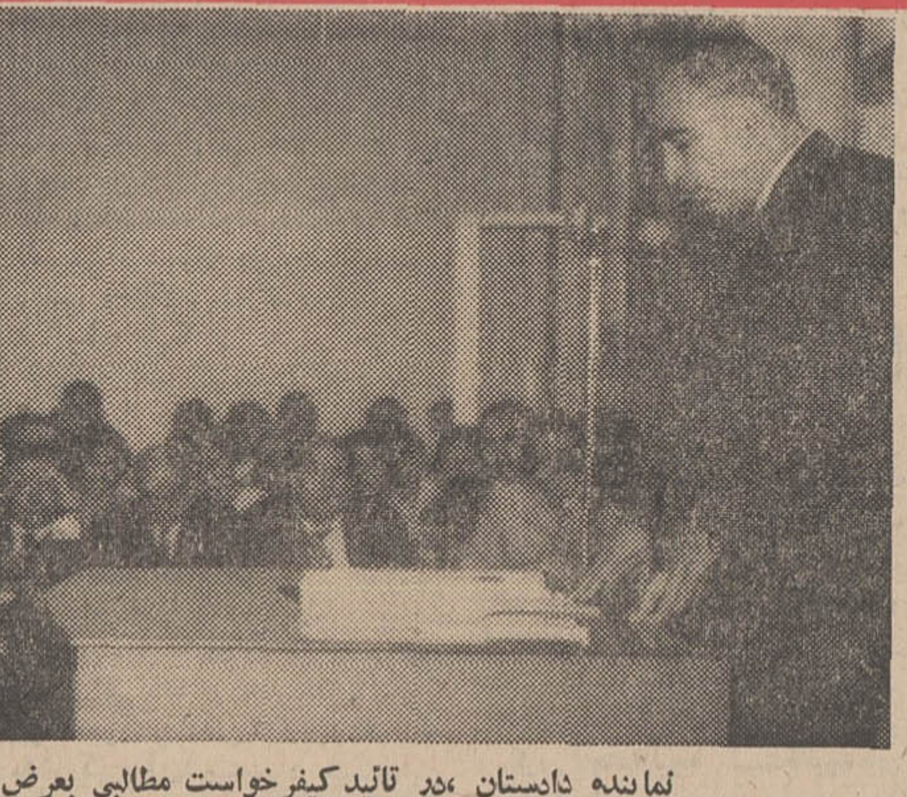
نماینده دادستان، در تأیید کثیر خواست مطالبی بر عرض دادگاه رساناد

● تأمین بیات مسلم است در مورد اتهامات آقایان بیات بیات، آرزوم باید رشوه و رشوه در تصدی بیات بیات چهار فقره رشوه با توجه به مطالبی که آقایان در نزد