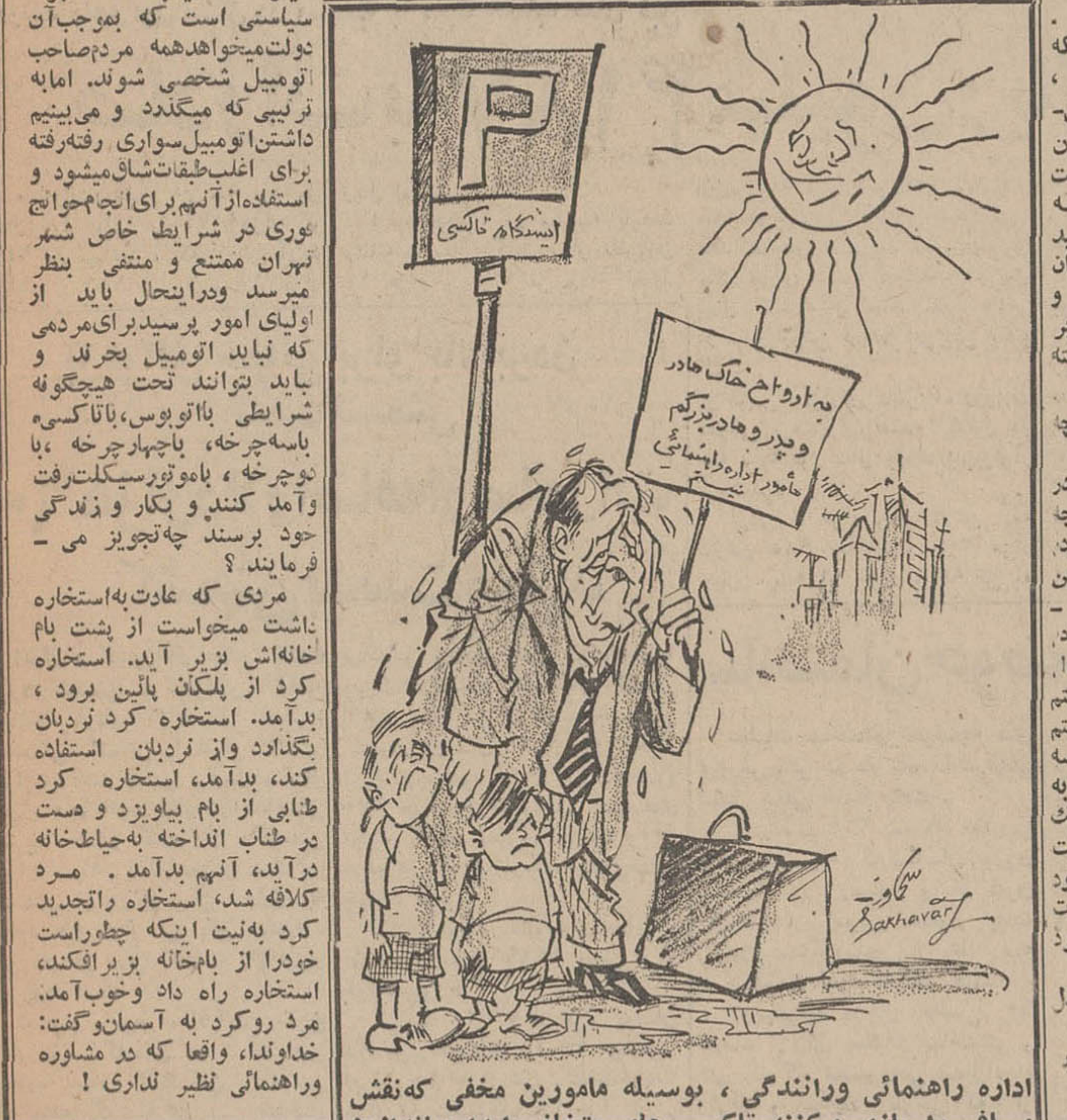
اداره راهنمایی و رانندگی، بوسیله مامورین مخفی که نقش مسافر را بازی میکنند تاکسی های متخلف را بدام میا نندازد!

باند های اداره راهنمایی و رانندگی، نه تنها هیچ سرانند و تا کسی رسیده است بلکه سوار بیای پبل تا کسی و تا کسی بدها نیز عموماً چاره انداز واز ترس آنکه مبادا گریه و شاخشان بزرد آهسته میروند و آهسته می آیند و معمولاً از قبول مسافرت معذرت میخواهند. در چنین شرایطی اگر دولت مقررات صادرات و واردات را در جهت تعدیل ورود اتومبیل عوض تکرره و باعث نشده بود قیمت اتومبیل به اصعاف مضاعف با لا رود و بعد هم از چهار طرف صاحبان اتومبیل را در منگنه مالیات و عوارض و بیبه شخصی ثالث و امثالهم نمیکشادست ممکن بود آدم خیال کند اینها همه اجزای سیاستی است که مردم بوجوب آن دولت معذرت میخواهند. مردم صاحب اتومبیل شخصی شوند، اما به تربیبی که میکشند و می بینیم داشتن اتومبیل سوار و رفته رفته برای اغلب طبقات شام میشود و استفاده از آنها برای اجاره اجاج عوری در شرایط خاص شهر تهران منتفع و منتفی بنظر میرسد و در این حال باید از اولی امور پرسید برای مردمی که نباید اتومبیل بخرد و باید بتوانند تحت هیچگونه شرایطی با اتوبوس، با تاکسی، با سه چرخه، با چهار چرخه، با دوچرخه، با موتورسیکلت رفت و آمد کنند و بکار و زندگی خود برسند چه تجویز می فرمایند؟