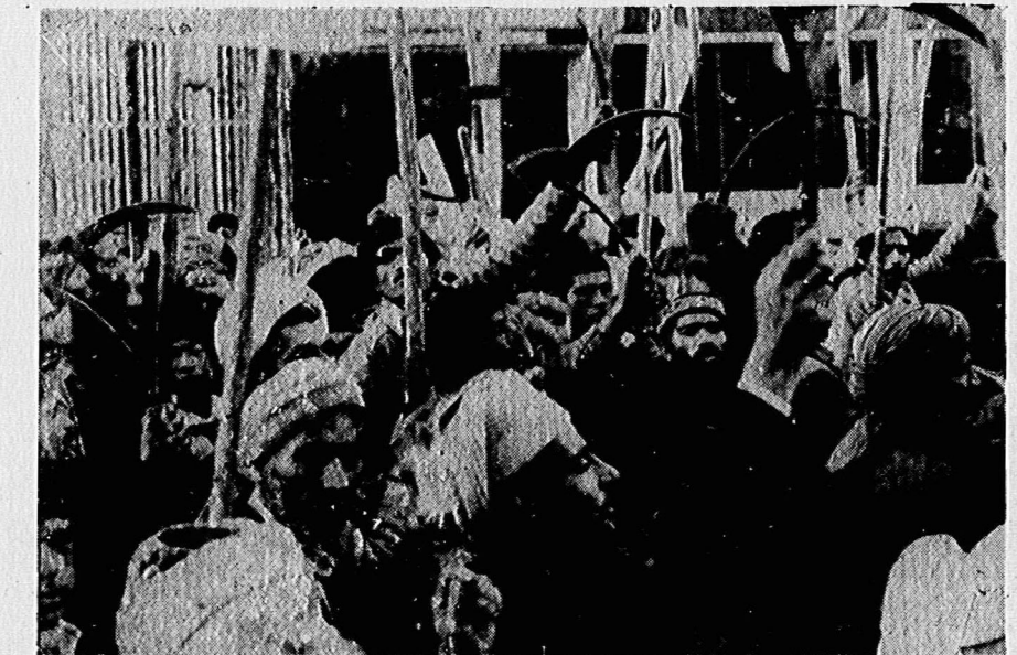
دهقانان زحمتکش خراسان حق خود را میخواهند: زمین و آب. (شرح در صفحه ۳)

ببرک کارمل، رئیس جمهوری دمکراتیک افغانستان، طی تشریح سیاست خارجی جمهوری دمکراتیک افغانستان گفت: «دولت افغانستان در حالیکه انقلاب نوین، اسلامی، ضد امریالیستی و ضد سلطنتی نموده های عظیم خلفهای برادر ایران را شاهدانی میکند، اینکه نزدیک و فکرمند دوستی مسلمانان کشور دوست را که رشته های مفسدانه تاریخی و بهم پسته دارند و در ماهیت امر کوچکترین اختلافی در بین نیست، دوست خواهد کرد.»