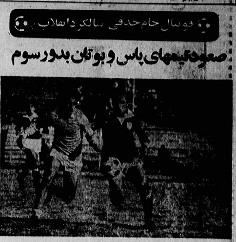
بندی هیوز در ازمه پاس و تکوا بازی آموزشی را بر سر صاحب توپ در حال دنبال میبندد. فرانس بازی پاسها با دو گل از سد تیم برزیلی گذشت.