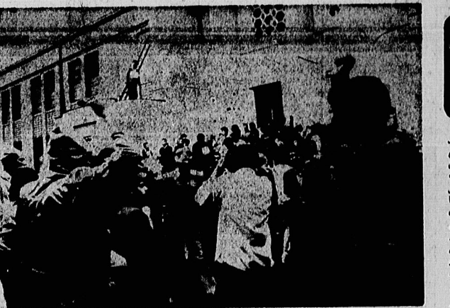
زندانی کردن دیپلماتهای امریکایی اقدام خارق العاده ای در مخالفت با استیلا امریکا و وسیله ای برای تأمین خواست های یک ملت بود.

صورت آن آدمی را از زرده خاطر میکنند، بیفتن، کندن چنین از رحم مادر، و غیره جزئی از این کارها بوده است.