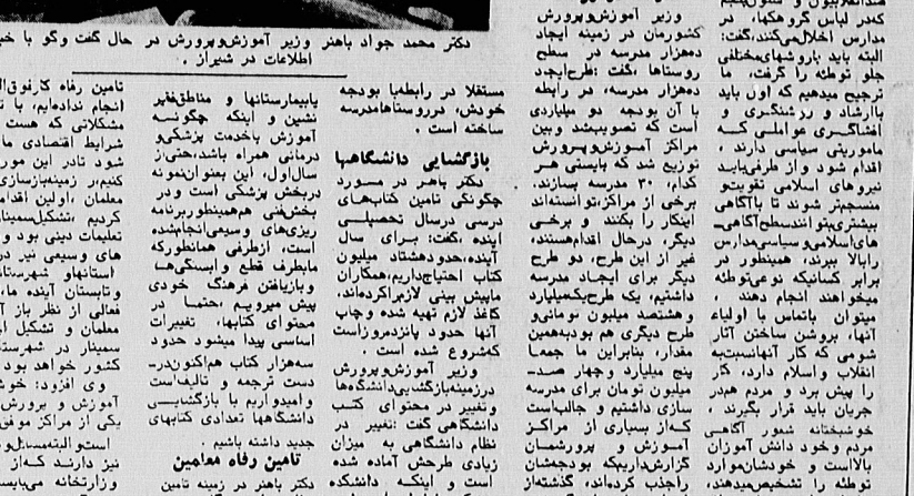
دکتر محمد جواد باهنر وزیر آموزش پرورش در حال بحث و گفتگو با خبرنگار اطلاعات در شیراز.

برای ایجاد مدارس روستایی در سطح کشور، هملیار دو چهارصد میلیون تومان بوجه در نظر گرفته شده است.