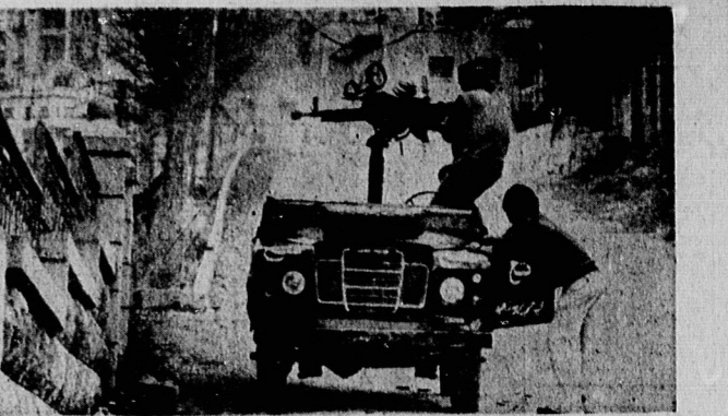
صحنه‌ای از جنگ های خیالی در لبنان ؛ لیسان که زمانی بیرون ۱۶ کت‌های گوناگون در آن با اوضاع زندگی می کردند ؛ اکنون در آتش توپخانه سوسیالیست‌ها در بیسمل سوخته و آوار شده است

تغییر موضع داد ؟ ۱- کذبتی که از طرف سوریه تسلط‌ناخته نخست‌وزیر دیگری آتش‌کشیده شد ۲- بر روی جبهه لبنان که در روزی بمباران آتش‌کشیده شد ۳- درگیری‌های در جریان لبنان و موفق سازمان ملل ۴- ترمیم کل نقش شیطان و موفق سازمان ملل ۵- درگیری‌های در لبنان و موفق سازمان ملل ۶- ترمیم کل نقش شیطان و موفق سازمان ملل