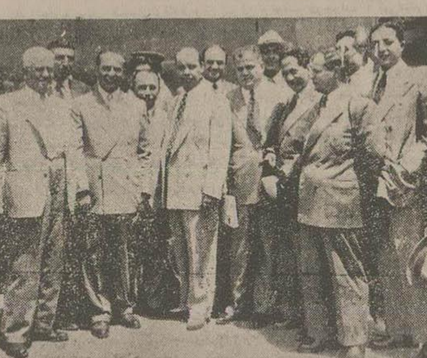
دکتر تقی نصر و همراهان در ورودی فرودگاه تهران

ساعت ۱۱ امروز، آقای دکتر تقی نصر وزیر دارایی، با هوای بسیار از ژنو وارد تهران شدند. در فرودگاه معاونین وزارت دارایی و رؤسای ادارات و عده ای از معترمین از ایشان استقبال کردند. ایشان بلافاصله پس از ورود در کاخ ایبش حضور یافته و آقای نخست وزیر را ملاقات کردند و پس از مذاکراتی که درباره کارهای وزارتخانه بعمل آوردند، بوزارت دارایی رفته و مشغول کار شدند. بقرارداد اطلاع ایشان از طرف آقای نخست وزیر فردا بپجلس سنای معرفی گردیده و روز سه شنبه نیز بپسائنده گان مجلس شورای ملی معرفی خواهند شد. در این عکس آقای دکتر نصر در میان مستقبلین دیده میشوند.