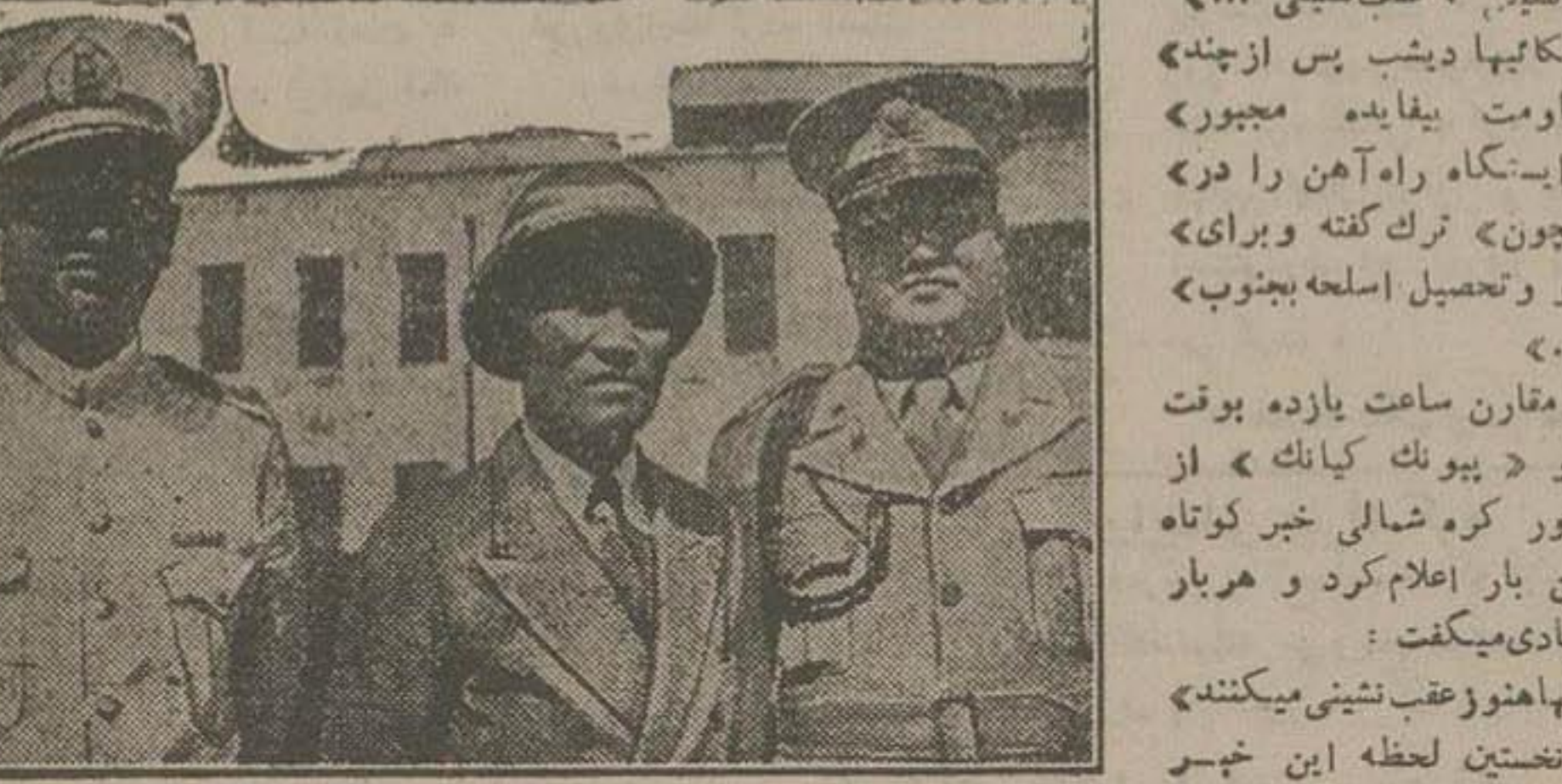
سران دفاعی ارتش کره جنوبی در مناطق جنوبی با استفاده از کمک امریکا مشغول جنگ می باشند. از راست به چپ: دریا سالار شون و نبل فرمانده ناوگان کره جنوبی شین سونگ ما وزیر دفاع. کره جنوبی و ناموزور ژنرال شو بونگ ری میس ستاد ارتش کره جنوبی.

کمیته مطالعات ازوبائی دیروز طی گزارش پیشنهادی خود بدولت انگلستان اعلام نموده است.