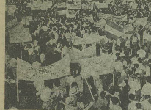
کوشه ای از جریان تظاهرات دیروز