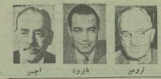
ایچسن، بایرود، ترومن، استیونسی، گنفرود، آیدن

اولیای وزارت خارجه انگلیس و آمریکا هنوز سرگرم مطالعه پاسخ آقای دکتر مصدق به پیشنهاد مشترک هندرسن سفیر کبیر آمریکا و میس دلتن کارداد سفارت انگلیس هستند گفته میشود تا آنکه نخست وزیر ایران پیشنهادات آمریکا و انگلستان را بطور کلی قبول نکرده جواب منفی نداده است ایدن و اچسن دیشب بیش از یک ساعت پیرامون پیشنهادات دکتر مصدق مذاکره تلفنی کردند گنفرود سفیر آمریکا در لندن نیز دیروز یکبار بطور تفصیل در باره حل مسئله نفت با ایدن گفتگو کرد در لندن اظهار امیدواری شده که مسئله نفت بزودی حل خواهد شد در مذاکرات روز چهارشنبه موضوع امکان ارجاع قضیه نفت به حکمت بین المللی مورد بحث قرار گرفته است تا آنکه «جونز» قبل از مسافرت تهران بارشس جمهوری آمریکا ملاقات و مذاکره کرده است ترومن رئیس جمهوری آمریکا در مصاحبه مطبوعاتی خویش گفت: مسافرت جونز صرفاً جنبه آشنائی با وضع صنایع نفت ایران را دارد درخواست دولت ایران برای دریافت وام آمریکا مجدداً مورد مطالعه دولت آمریکا قرار گرفته است