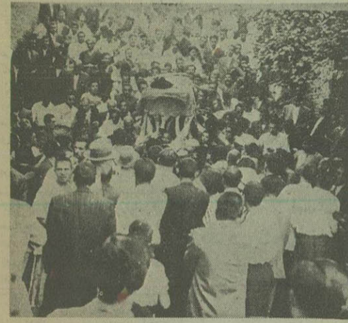
جنازه آیت الله خوانساری روی دوش مردم تهران به مسجد سلطانی انتقال داده شد

خبر نگار یونایتد پرس در لندن در گزارش خویش اضافه میکند دولت محافظه کار انگلیس باید این حقیقت را در نظر بگیرد که با اعلام ملی شدن صنعت نفت ایران در برابر یک عمل انجام شده قرار گرفته و چاره ای ندارد جز اینکه در این خصوص نظریات ایران را رعایت کند. اولین اقدام لندن برای تجدید بقیه در صنف پنجم