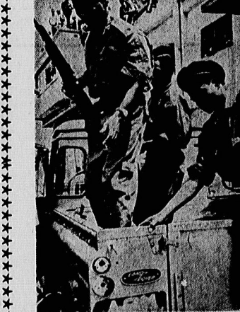
آنگولا، در راه حقیقی و استقلال، جاری و جز جنگین و سلاح بر گرفتن نیست ... بهای استقلال واقعی را اینکه باید به تمامی پرداخت.

بیش از ده سال است که دنیای استعمار دچار تحولات روز افزون و شدیدی شده و بنای ترک برداشته آن، در حال ویرانی است. چندین سال است که تاریخ دنیا، تاریخ مبارزه انسانها بطرف شرق خوش - مسالمت و شخص و مینمی را برای مردم مطرح ساخته است. امروز از انسانهایی که زربار ستی و رفیت ملل بیگانه قرار گرفته بودند، دعوت میشود تا در ویرانی بنای استعمار پناهی آسانی که جنبشها با طلیت جهان باشد، ممکن و با ارزش گردد. پیش از باز ده سال است که وظیفه هر فرد آسانی که متعلق به شخص و رویش است؛ باید در سرزمین خود پناهی استعمار را ویران سازد و از مبارزه مردم استعمار شده بصورتی قاطع و مثبت طرفداري کند.