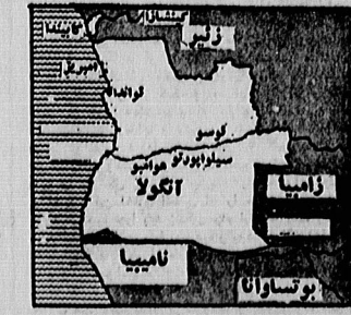
در طول جنگهای استقلال طلبانه (۱۹۶۱-۷۵)

جمعیت آنگولا ۳۴۹۰۰۰ نفر برآورد میشود که این آمار بنیتی بر آخرین سرشماری رسمی در سال ۱۹۷۰ (۱۹۶۹) (۲۶۹۱۰۰۰) و احتساب افزایش سالانه (۲۰۰۰۰ درصد) جمعیت کشور است. غالب اقوام آنگولا بوسیله برقیالی و به دنبال مقاصد استعماری آنها ساخته شده در حال حاضر ۷۵ شس و شیرک در این کشور وجود دارد که فقط ۱۸ درصد جمعیت آنگولا ساکن آنها میباشند.