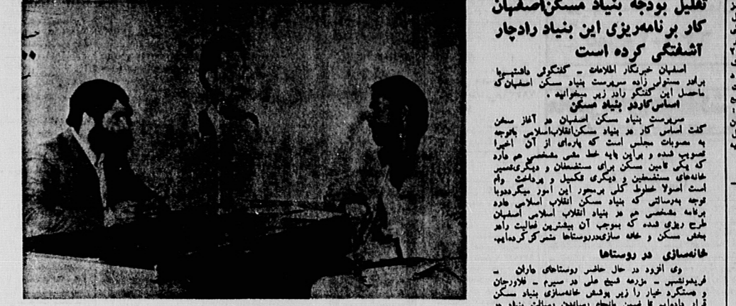
سریست بنیاد مسکن انقلاب اسلامی در حال تکمیل با غیر کارگران اطلاعات

سریست بنیاد مسکن انقلاب اسلامی در حال تکمیل با غیر کارگران اطلاعات... این واحدها در اختیار مستضعفین شهر هاور و ستاهای استان اصفهان قرار گرفته است.