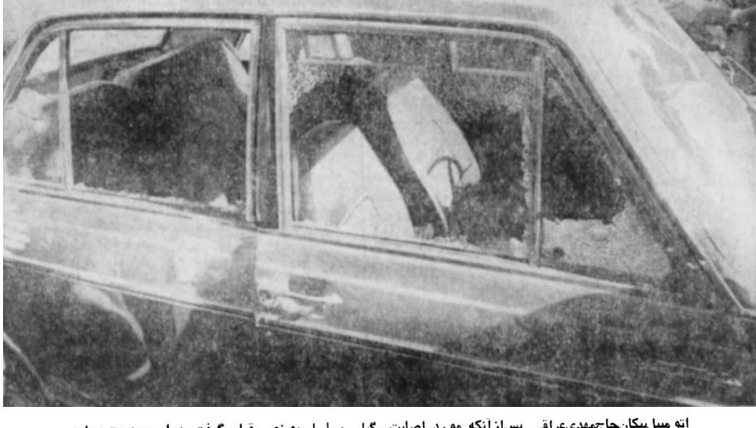
اتومبیل یکان حاج مهدی عراقی پس از آنکه مورد اصابت رگبار مسلسل بوزی قرار گرفت به این صورت درآمد