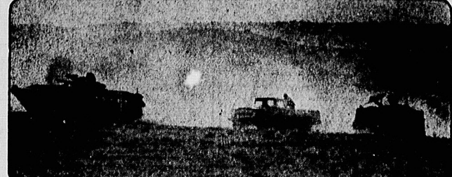
هنگ میان حماسه آفرینان انقلاب اسلامی ایران و مزدوران بشی بطول ۷۰ کیلو متر و عرض ۶ کیلو متر از جبهه پل به داخل خاک عراق کشیده شد. مکن بیروهای زرهی ایران را در حال پیشروی و عقب راندن مزدوران بشی بسوی خاک عراق در غرب کشور نشان میدهد.