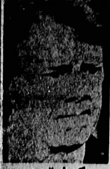
کارتر : آخرین روز غم انگیز ...

سخنگوی دولت ، امروز جزئیات توافق را در یک مصاحبه مطبوعاتی تشریح می کند