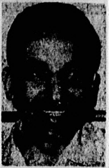
رجائی : ادامه مبارزه ...

سخنگوی دولت ، امروز جزئیات توافق را در یک مصاحبه مطبوعاتی تشریح می کند