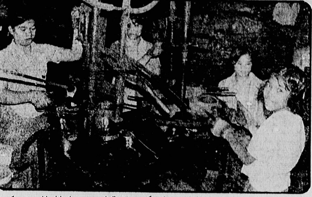
این چهار دختر و پسر خرسان تاییلندی نمونه‌ای از صدها هزار برندگان خرسان دیگر اسپر دست سرمایه‌داران تاییلندی هستند، که درحال بیکاری دادن به آنان می‌باشند.