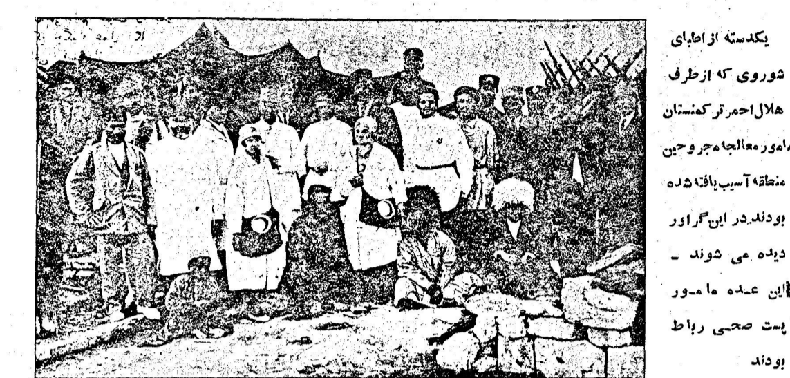
یک دسته از اطباي شوروی که از طرف هلال احمر ترکمنستان مامور معالجه جروحین منطقه آسیب یافته شده بودند در این گراور دیده می شوند - این عده مامور پست صحی رباط بودند