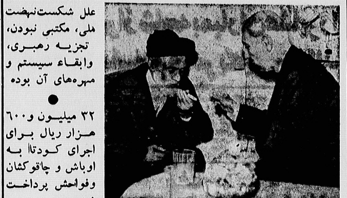
محقق و کتانی رهنمای نهضت ملی