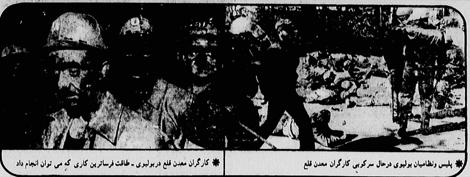
پلیس و نظامیان بولیوی در حال سرکوبی کارگران معدن قلع

از لوموند مهاجرت مسلمانان شورشی خونی شهر قهرمان مارا در ترکیه که در ماه دسامبر ۱۹۷۸ یکصد و یازده کشته بر جای گذاشت، نمودار روشنی از روشنی است که فرماندهان نظامی ترکیه در مقابل با اوضاع، در یک محیط جنگ داخلی پنهانی، پیش گرفته اند و آن تشویش و در عین حال مباهات روی سبی در برخورد با حوادث کشور است. استواری در برابر خشونت‌های سیاسی و مذهبی داری شهنشاد و هشتاد و دو تنم هاروت قهرمان مارا که بهشت آنها سنی بودند بزرگترین مهاجمه در تاریخ ترکیه بود. مهاجمه این عده روز ۲ ژوئن ۱۹۷۲ در کاخ ورزشی عدنه آغاز شده بود. شش دانش‌آموز نظامی برای دوست و هفتاد و چهار نفر از منتهین در خواست حکم اعدام کرده بودند. اما سرانجام دادگاه سنی و شش نفر محکوم بر گردید و بلافاصله حکم اعدام چهارده نفرشان به حبس ابد تبدیل شد. با اینحال در رای دادگاه هفتاد و دو تنم هاروت قهرمان مارا که بهشت آنها سنی بودند بزرگترین مهاجمه در تاریخ ترکیه بود. مهاجمه این عده روز ۲ ژوئن ۱۹۷۲ در کاخ ورزشی عدنه آغاز شده بود. شش دانش‌آموز نظامی برای دوست و هفتاد و چهار نفر از منتهین در خواست حکم اعدام کرده بودند. اما سرانجام دادگاه سنی و شش نفر محکوم بر گردید و بلافاصله حکم اعدام چهارده نفرشان به حبس ابد تبدیل شد.