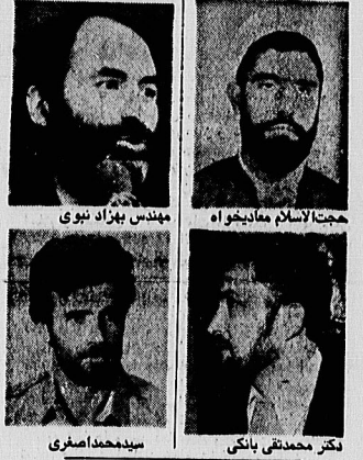
مهندس بهزاد نبوی مجتهد اسلام معابدخواه دکتر محمدتقی بانکی سیدمحمدافسری

نظرخواهی اطلاعات باوزرا درباره : علل صدور فرمان امام