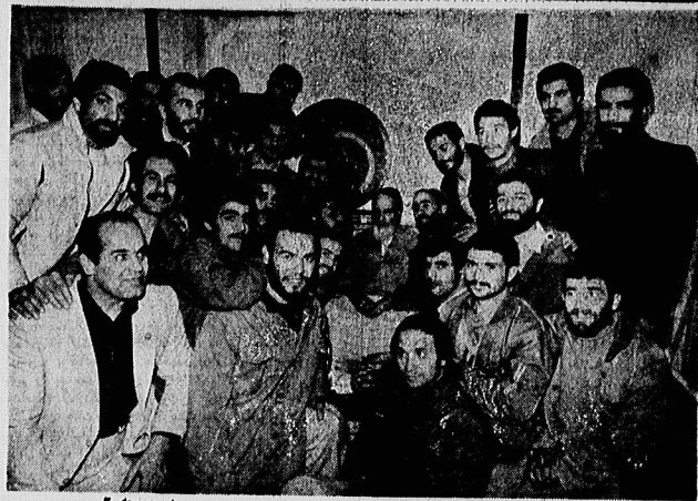
در صفحه ۴

مهم اینست که در کنار این پیروزیها، پیروزی بر نفس خودتان هم داشته باشید