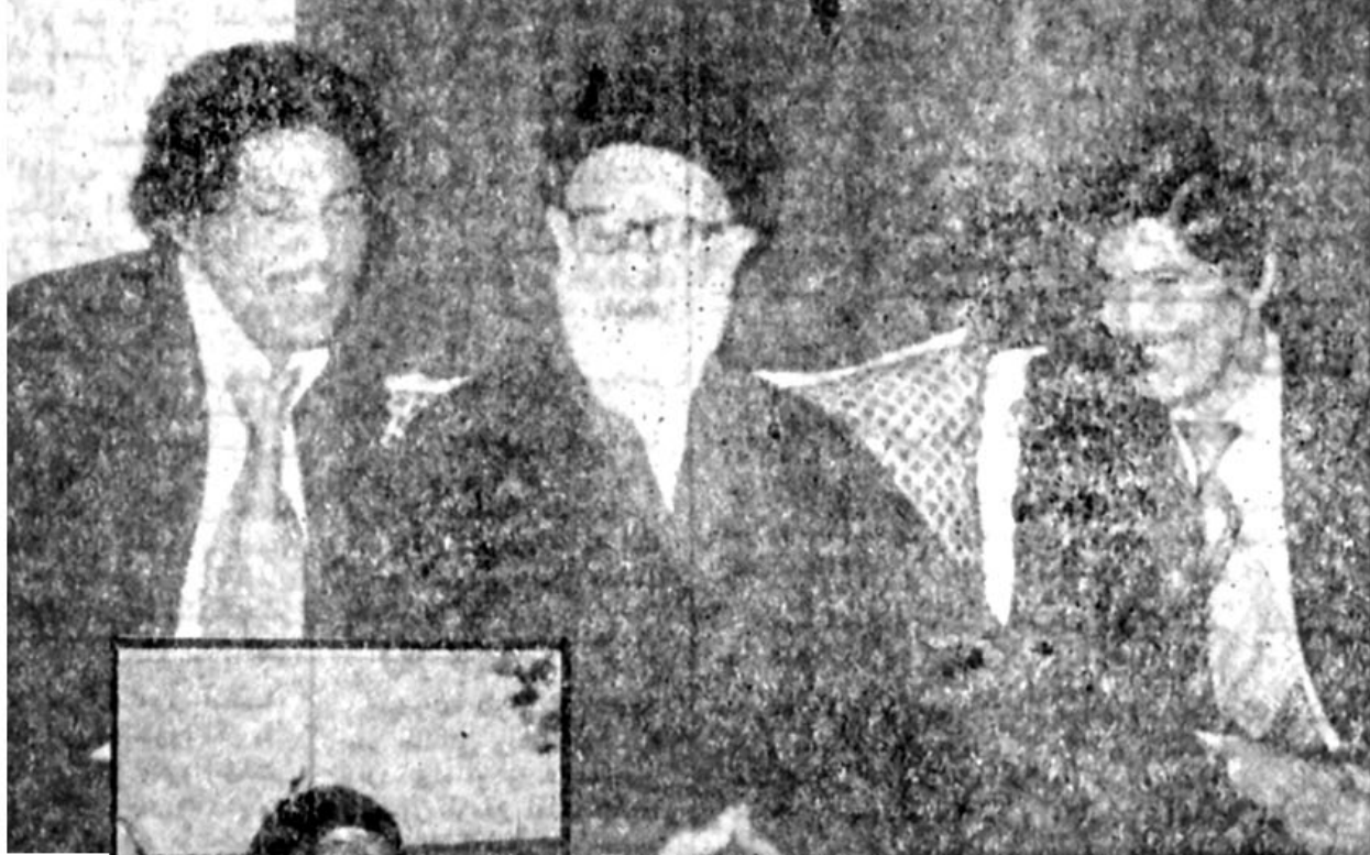
تبعیدگاه زابل (۱۳۵۱)