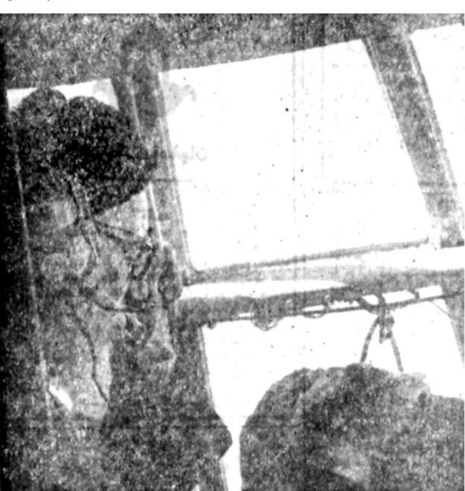
پیام به مردم سندج در کابین هلیکوپتر: فروردین ۵۸