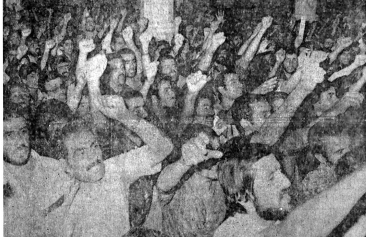
در مجلس یادبودی که از سوی شورای انقلاب و مجلس خبرگان در مسجد شهبازی مطهری برپا شده بود ، شرکت کنندگان با فریاد ها و شعارها ، یکبار دیگر با پدر طالقانی ، تجدید عهد کردند