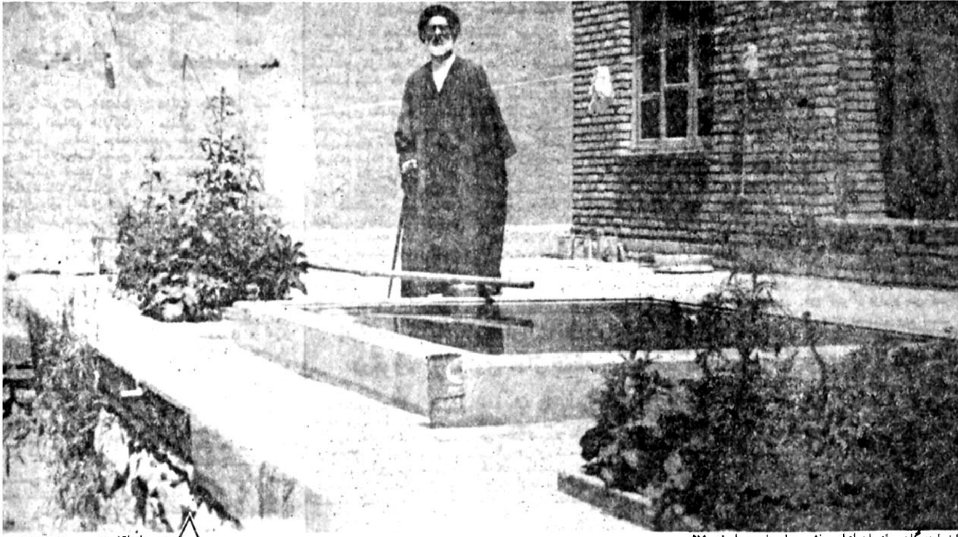
در محل اقامتش در بافت (۱۳۵۲)

مرگ اگر مرگ است، گو نزد من آی تا در آغوش فشام تگ تنگ من زاو عمری ستانم جاودان او زمن دلقی بگیری رنگ رنگ «مولوی»