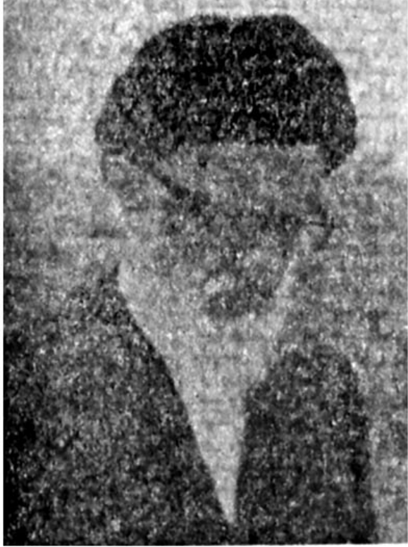
قم: اردیبهشت ۵۸