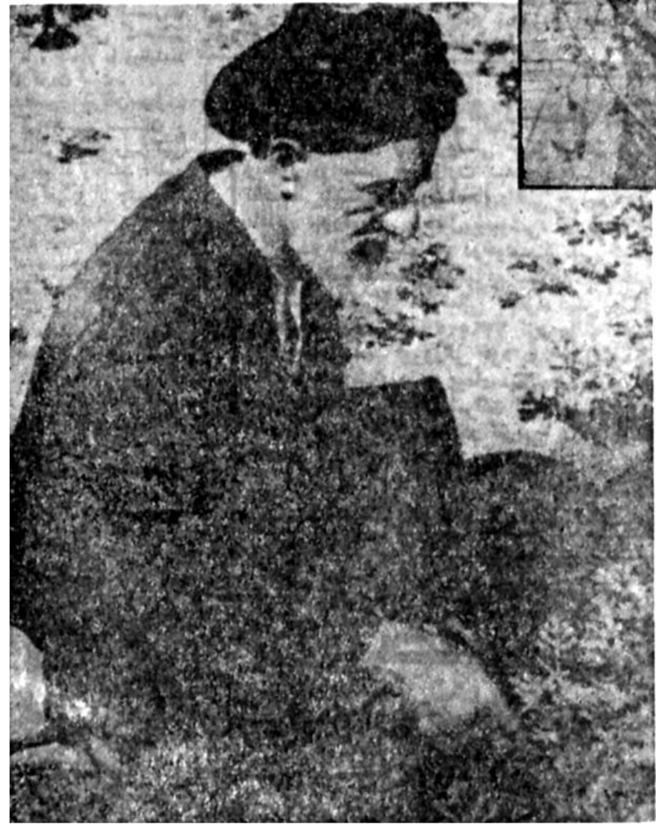
در تبعیدگاه بافت: ۱۳۵۲ - سرگرم باغبانی