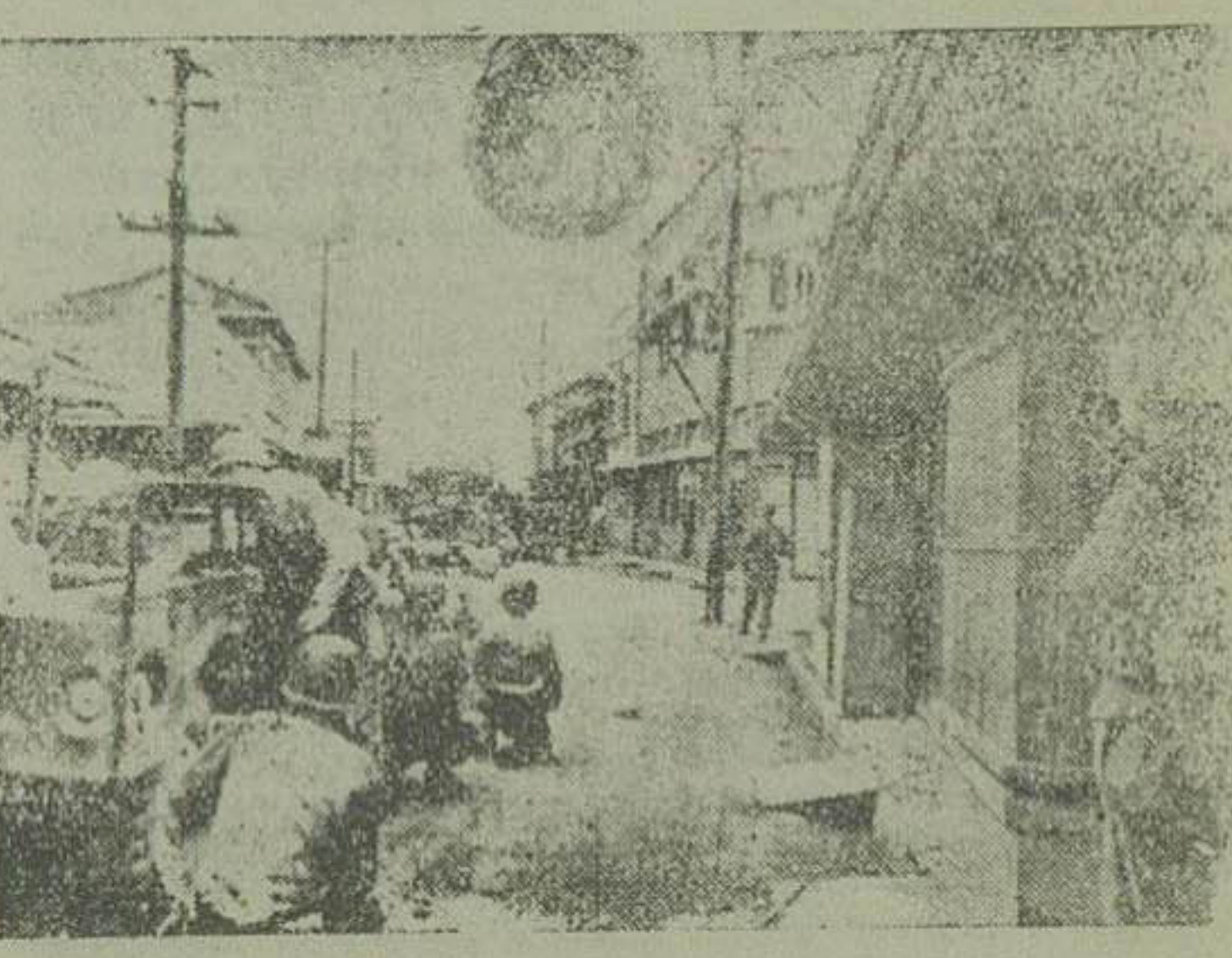
منظره ای از وضع شهر بوهانک که تحت تصرف امریکاییها درآمده و در این حال مورد تجاوز سربازان کمونیست قرار گرفته و بوسيله سربازان امریکایی دفاع میشود

چسب دکسترین بترین چسب برای چسباندن اکت روئی شیشه چسب مقوا بنگاه گراور سازی امروز فردشده لوازم چاپخانه نچیان فروشی مقابل کوچه خندان ۳۹۷۰-آ ۴-۴