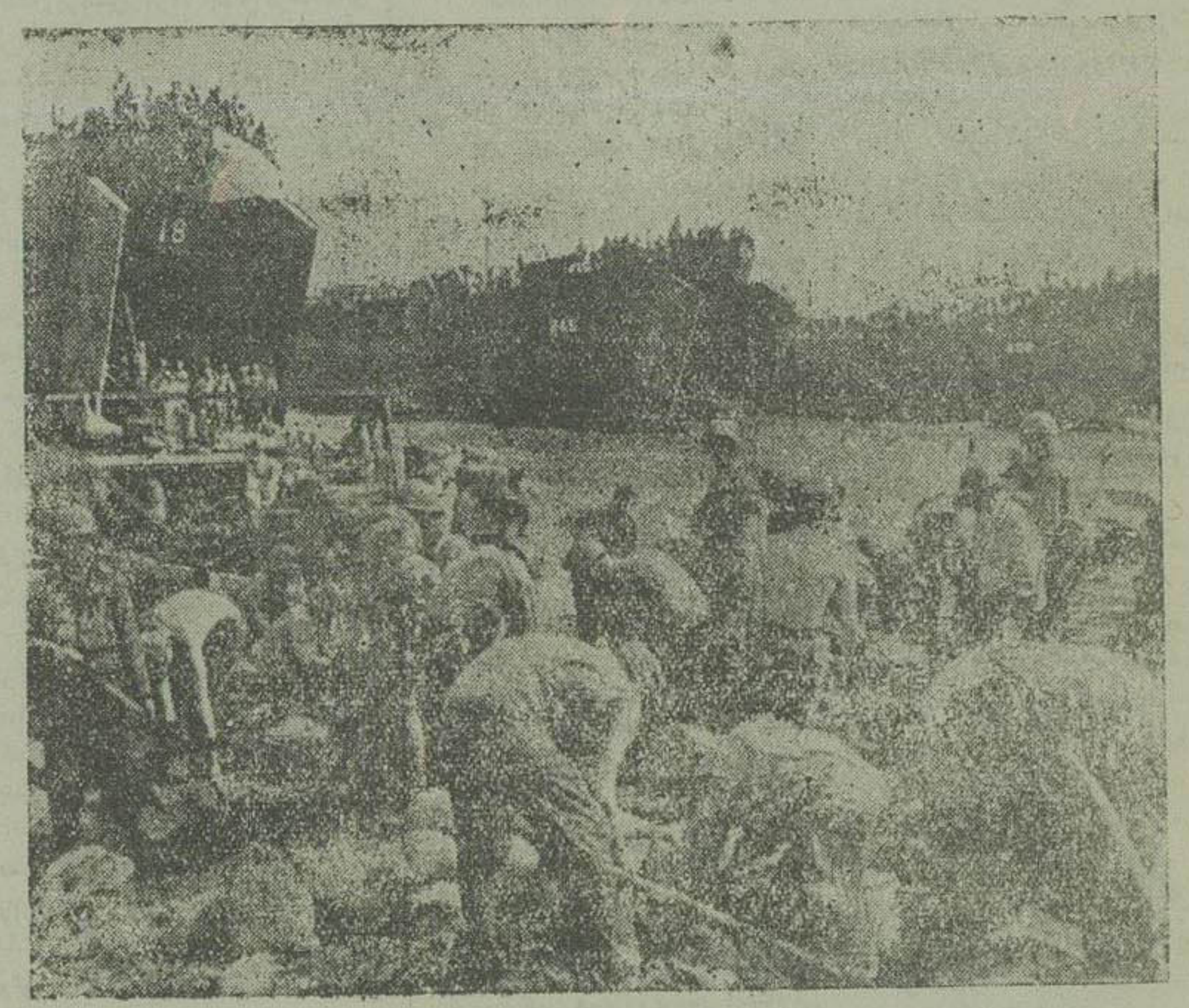
یک منظره از طرز زیاده‌شدن سربازان پیاده نظام آمریکا در خاک کره که بوسه کشی از گفورد امریکایی آبهای خاور دور انتقال یافتند

بسیار از سقوط ستون چنانکه حوادث مشروح دوران جنگ پس از سقوط ستون پایتخت کره جنوبی تا امروز شان میدهند برخلاف تصور ناظرین دوره افتاده جهان پیشرفت‌هایی را که در روزهای نخست نصیب قوای مهاجم کمونیست گردید یک پیروزی قطعی نیتوان نامید زیرا با شرکت ناگهانی قوای ملل متحد در جنگ آرزوی تسلط کمونیست‌ها بر سرزمین کره جنوبی نقش بر آب گردید. مشاهده و مطالعه در اوضاع واحواچ جنگ حقایق و آشکار می‌سازد که ما از نظر تفسیر و اطلاع خوانندگان بدگر پاره‌ای از نکات آن میگردانیم (۱) در موارد وقوع حالات ناگهانی همیشه تا آنجا که سالیان دراز سوانح و حوادث گذشته نشان داده است پیشرفت تامنت محدودی با دشمن است زیرا تدارک قوای کافی و شافلفکر کردن طرف این فرست راه پیروی مهاجم میدهد که تاملندی به پیشروی خود ادامه دهد چنانکه در محاربات ۱۹۴۱ تا ۱۹۴۵ که در خاور دور بود وقوع پیوست پیروزی عظیم و پیشتاور امراتوری ژاپن که سالها خود را برای تهاجم بکشورهای آسیا آماده ساخته بود قسم اعظمی از آبهای اقیانوس شرق و کشورهای خاوری آسیا را باشتال قوای خود در آورد ولی تدریجا ائتلاف روز افزون نیروی متفقین باین پیروزی خانه داد و آخر الامر بشکست دستگاه عظیم منتهی گردید.