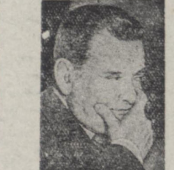
ولین بار در کره بموقع اجرا گذاشته شده است لاینل

و چین باشد - نخست وزیر فرانسه اظهار کرد که اصل اهمیت عمومی برای اولین بار در کره بموقع اجرا گذاشته شد