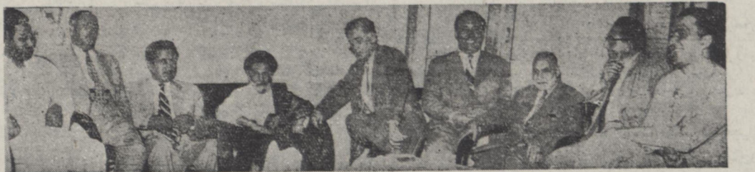
چند نفر از نمایندگان اقلیت در جلسه ملاقات امروز با آیت الله کاشانی

نمایندگان اقلیت امروز برای جلوگیری از رفتن آرای خود را نمودند در جلسه مشترکی که صبح امروز از نمایندگان غیر مستغنی در منزل آیت الله کاشانی تشکیل شده بود تصمیم گرفته شد اعضای فراکسیون آزادی و نجات نهضت در مجلس متحصن شوند و آیت الله کاشانی از فردا شب در منزل شخصی جلسات سخنرانی تشکیل دهند نمایندگان اقلیت امروز تلگراف اعتراض آمیزی بمصدق مخابره کردند سخنگوی اقلیت امروز گفت ما بسازمان ملل متحد شکایت خواهیم کرد حسین مکی امروز طی نامه ای بمدی کل بانک و رئیس دیوان عالی کشور اطلاع داد هر نوع فعل و افعالی در نشر اسکناس و پستو آن بعمل آید بایستی با نظارت کامل او باشد و تخلف از آن موجب مسئولیت خواهد بود