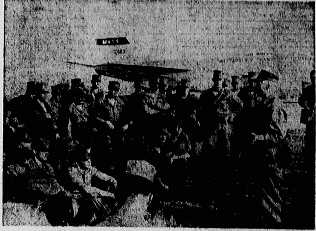
تکسی از حضور لندرمایه نظامیان آمریکا در پایگاه دریایی «گوانتامو» در کوبا امروز آمریکایی لاین یکبارچه علیه بانکها شوریده است. قتلحای شکست سیاست سلطه طلبی آمریکا در این قاره نمایان شده است.

رئیزان نظامی آمریکا که سربازان و نیروهای شیطانی حکومت را برای سرکوب خلق مباحثه آموزش می دهند، میزان خسارت ۹۹ میلیون دلار بوده است. (میکروسی از روسای این شرکتها می کنند که کشور فاجعه سختی را تحمل کرده است . مامی خوانستین چنان تاسیسات را ویران کنیم که کلا بولیات متوقف شود . محاکمات و مجمع دیگری را یادی یک شرکت آمريکاي در دست ساختمان است . ما قصد داریم این مجتمع را هم منهدم کنیم . در آخرین مراحل طرح بیژرفته بودیم ما موفق نشدیم .