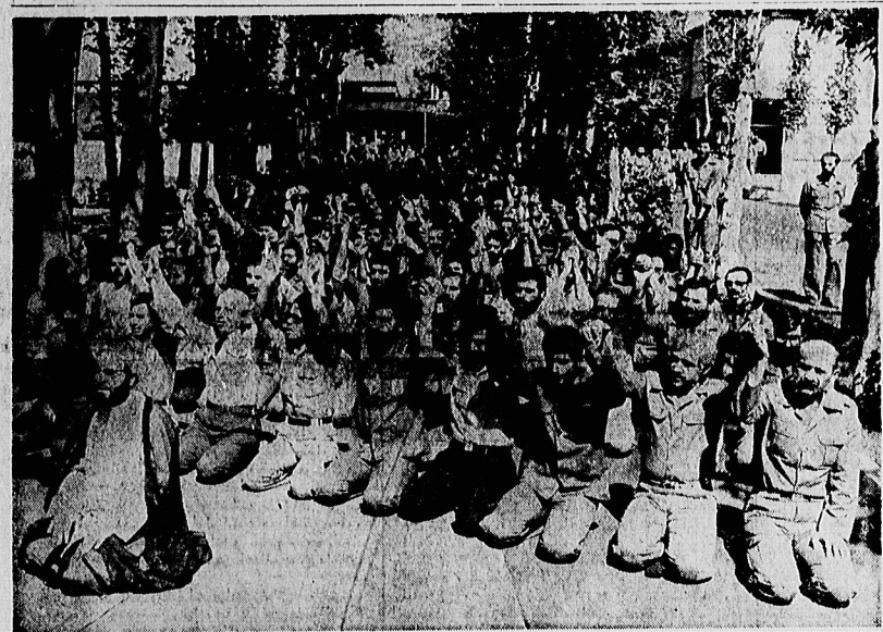
فرماندهان ارتش و سپاه در روزی وحدت آفرین، پس از بحث و گفتگو بر امضای اسامی مربوط به جنگ تحمیلی عراق علیه ایران، چون صفتی واحد در کنار یکدیگر به نماز ایستادند. عکس فرماندهان نظامی و سپاه پاسداران را در پایان نماز وحدت پیروز در حالی که دست های خرم گره کرده خود را به نشانه اتحاد در راه پیروزی بلند کرده اند، نشان می دهد.