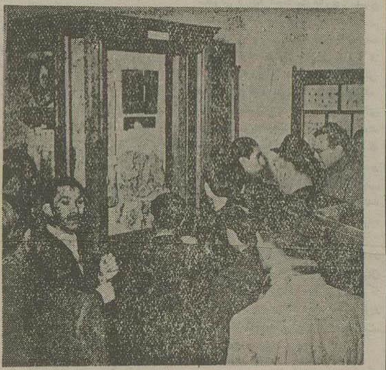
دو نفر از استادان منتظر خدمت دانشگاه