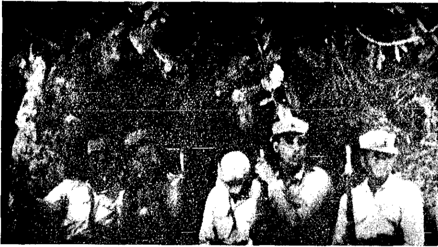
عده‌ای از مرزداران افغانی در مرز پاکستان. بدنبال کودتای افغانستان، مرزهای این کشور بسته شده است.

دله‌نو - خبر گزرها - چنین سه نظر سررسید که فرمانروایان جدید نظامی افغانستان دو روز بعد از اقدام به کودتای خونینی که در آن محمد داود، رئیس جمهوری کشته شد، حکومت نظامی خود را بر سراسر کشور مسلط کرده‌اند.