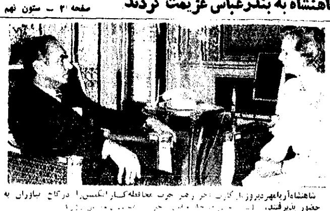
شاهنشاه به بندرعباس عزیمت کردند