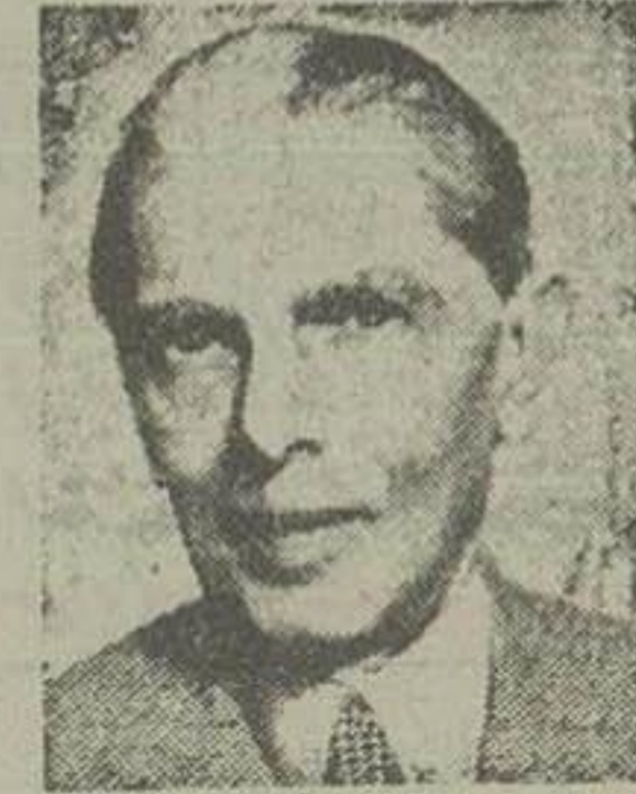
محمد علی جناح

امروز ملت پاکستان بیادند کارها و از خود گذشته‌گی‌هایی که در راه تانین استقلال و تحصیل آزادی خویش بخرج داده آغاز شصتین سال استقلال خود را جشن گرفته و شادمانی می‌کنند. ملت پاکستان که سالیان دراز در بقیه در صفحه دوم