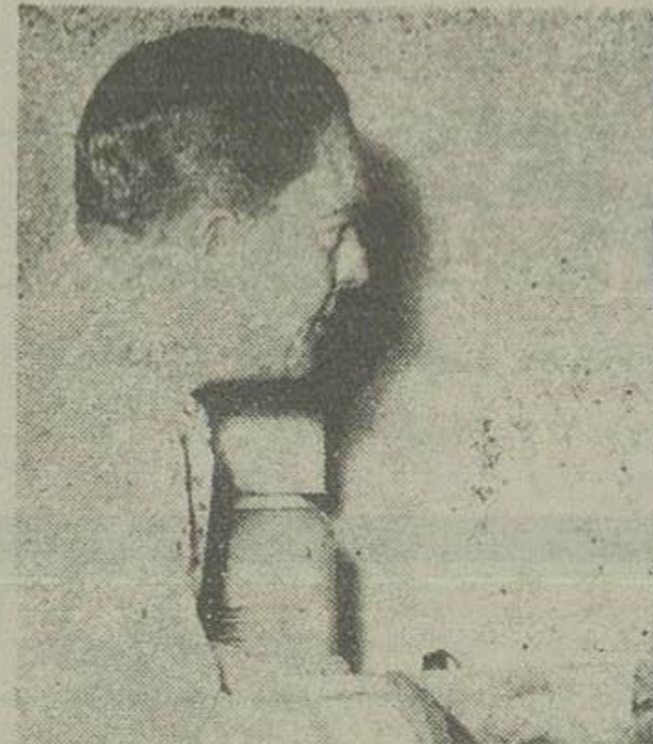
مذاکرات امروز آقای دکتر مصدق نخست‌وزیر و میلتن کاردار سفارت انگلیس قریب یکساعت بطول انجامید

آقای میلتن کاردار سفارت انگلیس ساعت ۱۲ امروز در منزل آقای نخست‌وزیر حضور یافت و با ایشان ملاقات و مدتی مذاکره کرده مذاکرات امروز در تعقیب ملاقات و مذاکره بود که دیروز کاردار سفارت انگلیس با آقای نواب وزیر امور خارجه بعمل آورده بود. بطوریکه اطلاع یافته‌ام آقای میلتن در ملاقات دیروز خود با آقای نواب نسبت بمعضی نکات و مطالب مندرجه در یادداشت ۱۶ مرداد وزارت امور خارجه در باره محل قضیه غرضات شرکت سابق و سایر مسائل مربوط بظرفت از طرف دولت انگلستان توضیحاتی خواسته بود. و آقای نواب جواب توضیحات مزبور بقیه در صفحه چهارم