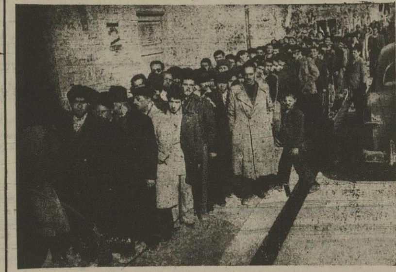
رای دهندگان از داخل حوزه مسجد اکیانان تاقستی از بیاد روی دای دهن رای دهن سر یکدیگر قرار گرفته اند

در نتیجه یک کفر ایرانی بقتل رسیده است دیروز مقادیر عصر عده ای از عشایر کرد عراقی بناحیه نفت شاه در داخل مرزهای ایران حمله کرده اند و در نتیجه یک کفر از اهالی کشته شده است یادگان محل برای عقوبت آن آنها تیراندازی کرده و عشایر عراقی را بقتل رانده است. امروز استاندار غرب و فرمانده تیپ کرمانشاه با عده ای قوای انتظامی بناحیه نفت شاه رفته اند. اطلاعات جدیدی اگر برسد تا تلفن خواهیم کرد. بقیه در صفحه دهم