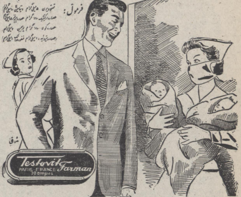
مرکز فروش بنگاه داوومی طلوسی - ناصر خسرو - ۱۸۰-۲